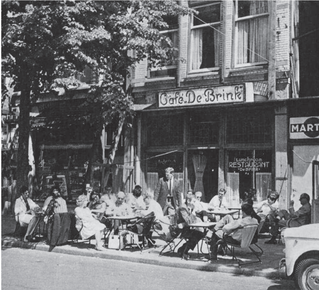
Het Brinkje in 1963

Één van markantste televisieplekjes in Bussum was café-restaurant "De Brink", dat gevestigd was aan de Brinklaan. Begonnen in 1937 als café en lunchroom, werd het na de Tweede Wereldoorlog een café-restaurant, en sinds november 1951, een maand nadat de Nederlandse Televisie Stichting (NTS) zich in Bussum vestigde, het 'televisie-stamcafé' van de NTS.