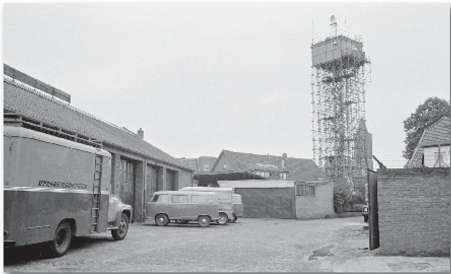
De Van Oeveren-garages en de PTT-toren in de Nieuwstraat

Overigens heeft de NTS begin zeventiger jaren, nog drie grote garages naast Studio Eltheto gehuurd, daar hebben dik onder het stof en met alle lucht uit de banden nog vijftien jaar lang reportagewagens gestaan die waren overgedragen aan het Omroepmuseum. Midden jaren tachtig gingen zij naar de fabriek terug in West-Duitsland om weer helemaal opgefrist te worden. Door een foutje in het contract kwamen ze nooit meer terug in Nederland en bleven ze in Duitsland.