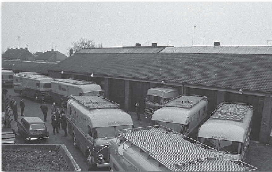
Een reportagetrein staat klaar voor vertrek