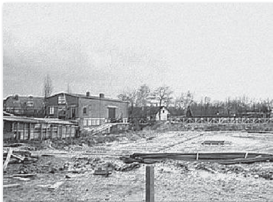
Boven: Kapelstraat 47a