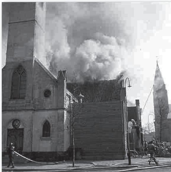
De zolder in lichterlaaie

Dit gebouw zou, na de bouw van de Lagere Technische School aan de Jan Bottemastraat, ook in gebruik worden genomen door de televisie.