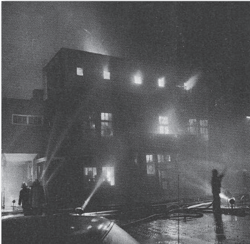
Het hele gebouw staats in vuur en vlam

daarop onvervangbare televisieopnamen, die in de kelder lagen opgeslagen, te redden. Door een menselijk ketting te vormen konden veel banden worden gered doordat brandweermensen voorzien van persluchtapparatuur in de kelder de banden pakten en deze aan buiten staande mensen doorgaven. Studioperoneel vertelde aan brandweerman J.J. Schuurmans dat de klok met de verspringende secondewijzer, die op de benedenverdieping stond en die altijd op het televisiebeeld kwam om aan te geven wanneer een programma begon, een onvervangbaar object was. Er zou niet snel een vergelijkbaar uurwerk te krijgen zijn. Tijdens de nablissing, in het begin van de ochtend, haalde Schuurmans op het laatste moment de klok uit het brandende ge-