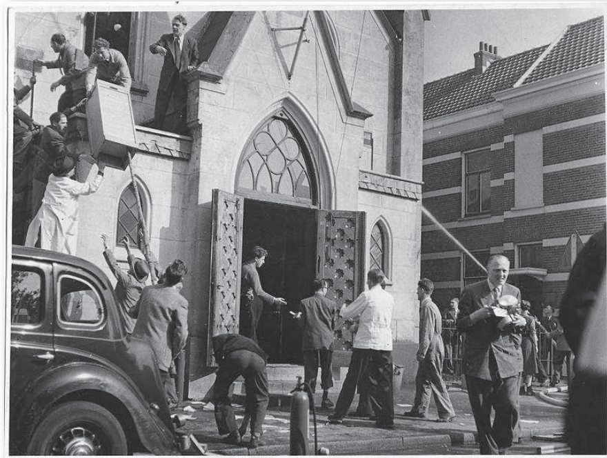
Redden wat er nog te redden valt