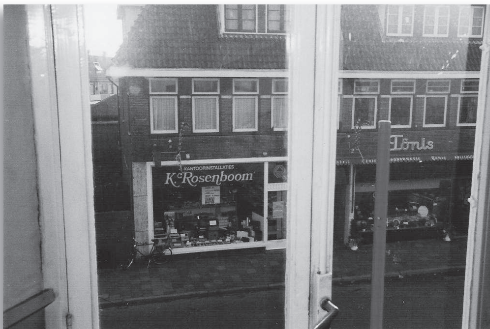
Uitzicht op Rosenboom en Tönis vanuit Studio Irene, collectie HKB