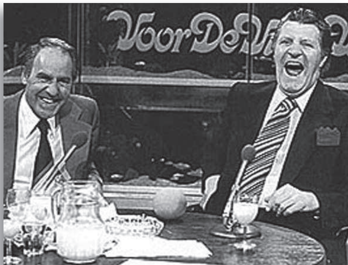
Willem Duys met Tommy Cooper

Gedurende het bestaan van de “Vuist” heeft die vissenkomp daar op tafel gestaan, tot ergernis van vele vissenkenners die in honderden brieven uitlegden dat de vissen onvoldoende zuurstof kregen in zo’n glazen gevangenis. Vandaar dat in augustus 1966 een uitzending plaatsvond zon-