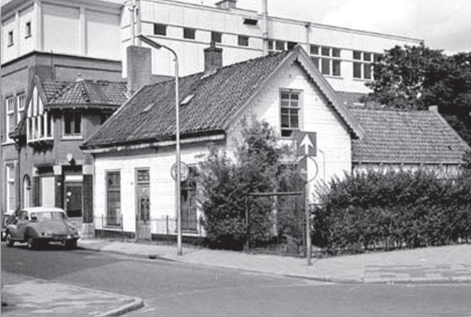
Vitus studio en bakker

Naast de Vitusstudio stond de bakkerij van "Van Leeuwen". Toen de bakker eind jaren '50 een toestel aanschafte deed het krenghet niet. Wat men ook probeerde hij kreeg een totaal vervormd beeld. De PTT die verantwoordelijk was voor het beeld in de huiskamer, kwam erbij, maar ook die konden het eerst niet vinden. Na een tijdje bleek de studio de boosdoener. Aan de andere kant van de huiskamermuur stond een enorme schakelkast en die gaf heel veel interferentie af en stoorde het beeld.