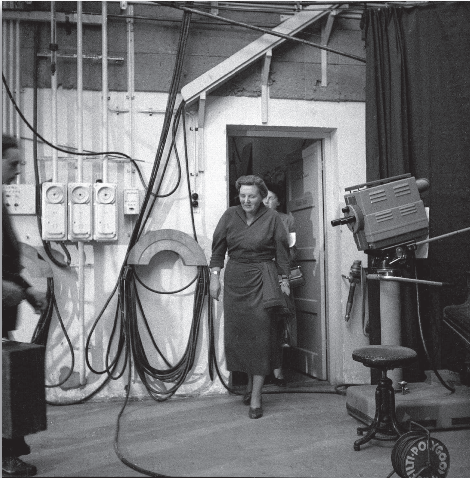
Koningin Juliana in studio Irene, november 1953