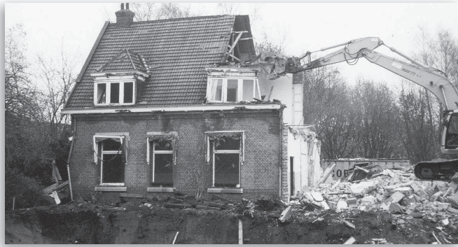
De sloop van de kazerne, november 2004

arts daarom het woonhuis Hooftlaan 26 af. De bewoners vertienden het pand in juni 1982, waarna het als dienstruimte door de brigade in gebruik werd genomen.