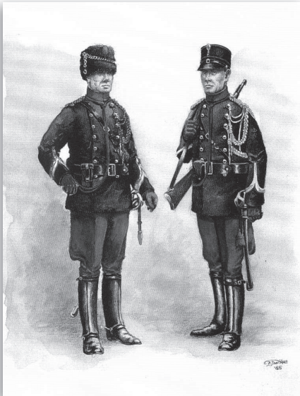
Marechaussees vóór 1940, Ansichtkaart Marechausseemuseum

Bussum was een van de gemeenten die voor legering van een brigade marechaussee werden aangewezen. De nieuwe brigade zou echter pas worden uitgezet wanneer zij over eigen huisvesting, dus een kazerne, zou kunnen