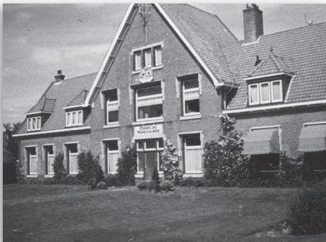
De kazerne aan de Hooftlaan

In de jaren '80 klaagden de marechaussees over de stank- en geluidsoverlast, die veroorzaakt werd door het naburige slachthuis. In 1981 keurde een militaire