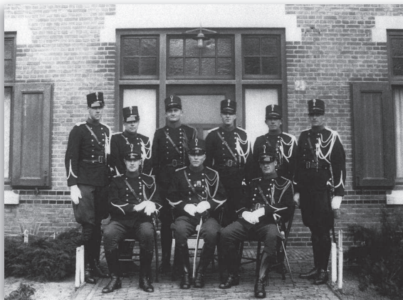
De brigade Bussum in 1935

Gedurende de Duitse bezetting is de marechaussee, ontstaan van haar predikaat 'koninklijk', samen met de rijksveldwacht als 'Marechaussee/gendarmerie', opgegaan in