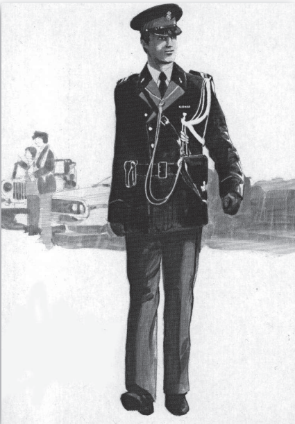
Marechaussee in hedendaags tenue. Ansichtkaart Marechausseemuseum

Een andere bezigheid van de garnizoensdienst was het opsporen en aanhouden van ongeoorloofd afwezige militairen en het overbrengen van gedetineerde militairen naar de zittingen van de krijgsraad 4 en vervolgens naar de gevangenis. Tijdens een van deze opsporingsonderzoeken hadden twee marechaussees "een zodanige oplettendheid aan de dag gelegd dat daardoor een tweetal personen (nozemans) aan de burger politie konden worden overgegeven als verdacht van joy-riding met c.q. diefstal van een burger personenauto" zo lezen wij in het notitieboekje van de brigadecommandant. Zij kregen daarvoor een tevredenheidsbetuiging.