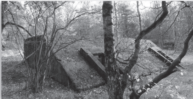
7. Het grote type

Afbeelding 7 is een onderkomen van het grote type (II). Ook hier gewapend beton met grof grint, resten van bitumenlaag op de schuine vlakken. Een stalen versterkingsmat is aan de dichte zijde en de zijanten bij beschadigde plekken te zien op 5 tot 10 cm diepte. De bovenzijde heeft een afmeting van 9,7 bij 2,6