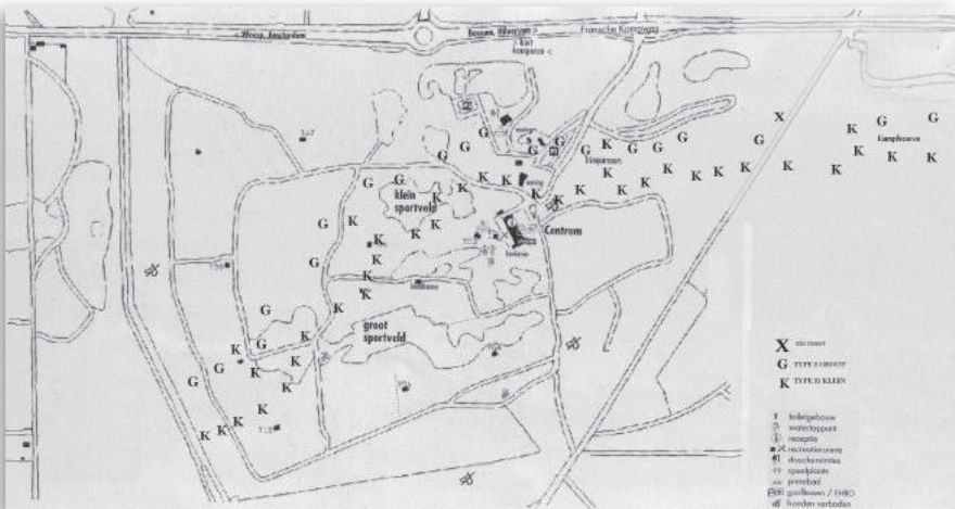
4. Overzicht van de Fransche Kamp en Kamphoeve met ligging van de onderkomens

3. Luchtfoto uit 1925 van zuidwestelijk stukje van Bussum. Onder v.l.n.r. de Fransche Kamp, Weg door het Kamp (fietspad), boerderij Kamphoeve (nu bos). Daarboven de Franse Kampweg. Midden v.l.n.r. het contour van de voormalige renbaan Crausbergen, de Nieuwe 's Gravelandseweg, de Fransche Kampheide. Boven v.l.n.r. Koedijk, Batterij aan de Koedijk (Werk I), deel van wijk Het Spiegel, de Zandzee (strandje), Batterij Bussum Vooruit, Werk II (nu zwembad).