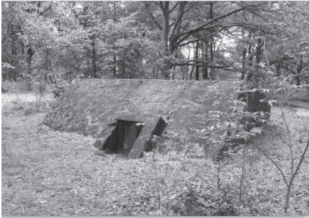
5. Het kleine type

doeld voor offensief optreden. In zomer 1918 werd deze voorstelling opgeheven. Alleen de genoemde 50 onderkomens zijn afgebouwd. Er werd in Den Haag weer anders gedacht.”