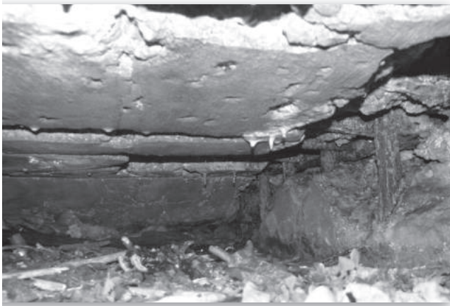
6. Opengemaakte ingang

Bij een andere is de ingang afgedekt met een stalen plaat. Na 1945 heeft men op het trimbaanterrein geprobeerd er een op te blazen. Een groot stuk beton bij de ingang is weg en er kan naar binnen gekeken worden. Alleen de bovenste circa 30 cm is vrij. 2 cm dik bewapeningsijzer is te zien. In een kuil vlak daarbij ligt een stuk beton, waarschijnlijk het ontbrekende deel. Bij een andere is bijna een meter betonnen wand weg. Ook zouden bij enkele openingen gemaakt zijn om vleermuizen toegang te verlenen. Veel onderkomens zijn