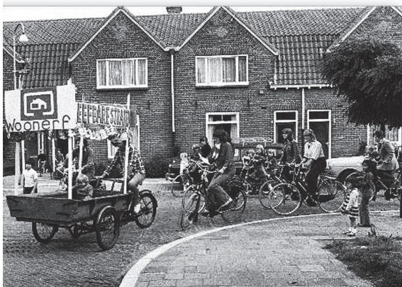
Fietsdemonstratie PSP voor veilige woonerven in het voormalige Josephpark, 1977