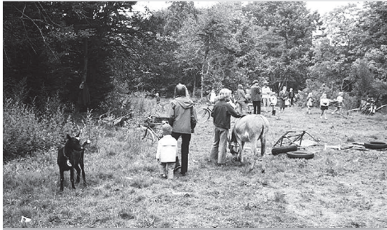
Volkspark, 1970, coll. M. Heyne

In 1970 schoot de kabouterbeweging ook in Bussum wortel. Of misschien moet ik zeggen 'worteltje' want in het standaardwerk over de kabouterbeweging Louter Kabouter van Coen Tasman, staat een kaart van Nederland met kaboutersteden. Bussum prijkt erop, weliswaar in de derde categorie: 'overige plaatsen met een kabouterbeweging'. Die beweging had zijn domein op de plek waar ooit de villa van Vroom had gestaan – op de hoek van de Kerkstraat en de Brinklaan. Het was in 1970 een wild begroeid park, dat omgedoopt werd tot Volkspark. Hier hield de Bussumse kabouterbeweging enkele bijeenkomsten. Ze gaven ook een gestencilde kabouterkrant uit. En dat was mijn eerste contact, want een van de actieve kabouters was Frans Bruning die met dit blaadje in het centrum colporteerde. Met Frans had ik in jeugdfeitallen van SDO gevoetbald en korte tijd in