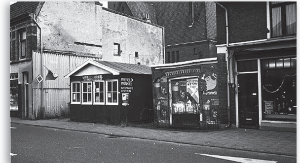
Wereldwinkel aan de Brinklaan, 1973