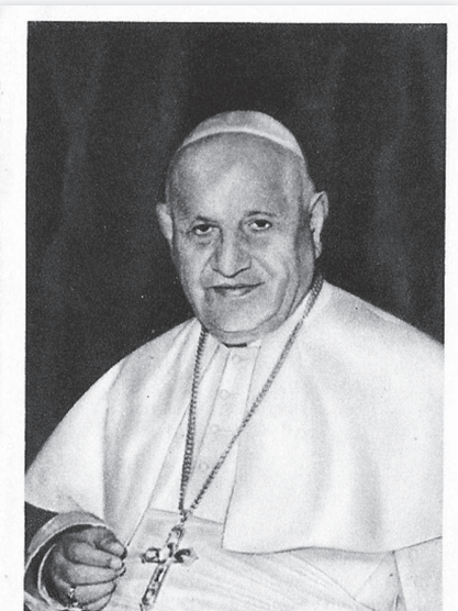
JOANNES P.P. XXIII

Precies. Dat heb je dan goed geleerd. Als je alleen maar in een harde bank mag zitten en luisteren naar een man die het alleenvertoningsrecht heeft en na jaren wordt gezegd nu gaan we de gemeenschap induiken, dan is dat toch positief.