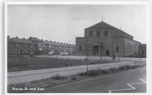
Bussum, St. Jozef Kerk