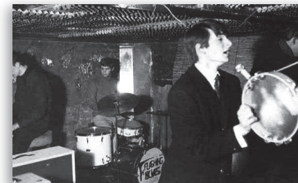
Optreden Flashing Blues in de Kelder

"Nou je begrijpt het wel, al bij het eerste nummer van het eerste optreden van Shock vlogen alle oudjes hoe doof ze ook waren bijkant uit hun stoelen en rolstoelen krampachtig naar hun oren grijpend en luid kermend nee...nee... niet meer... De apparatuur werd weer op de bakfiets geladen en met de kapotgeslagen