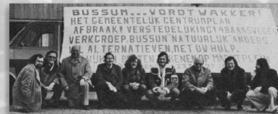
Actiecomitee 'Bussum wordt wakker!'

Aangekondigd wordt dat het plan de juridische weg zal gaan volgen en in procedure wordt gebracht. De bewoners van de straten waar gesloopt gaat worden krijgen rond die tijd een brief van B&W met de mededeling dat de voor-