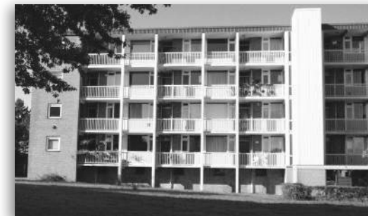
Lange Heul flatwoningen: een goed voorbeeld van het toepassen van stempels. Herhaling van gebouwen in een ruime groenzone. Direct aan het natuurgebied

Opvallend is de ruime stedenbouwkundige opzet, waarbij gebouwd werd volgens het principe van het Nieuwe Bouwen: licht, lucht, ruimte, groene wiggen en een sterke scheiding tussen wonen, werken, verkeer en recreatie. Voor de architectuur en de bouw was in die tijd aanmerkelijk minder geld beschikbaar dan nu. Dit uit zich in gebouwen die eenvoudig van opzet zijn en minimaal versierd zijn. Toch hebben de buurten door hun stedenbouwkundige opzet een hoge kwaliteit.