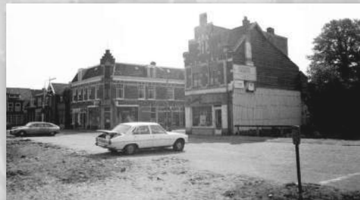
Klate vlakke na de sloop van het Gemeentehuis aan de Brinklaan

op zaterdag komen er nog 300 binnen. Het totale aantal bezwaarschriften komt daarmee uit op 4100. Een absoluut unicum voor Bussum.