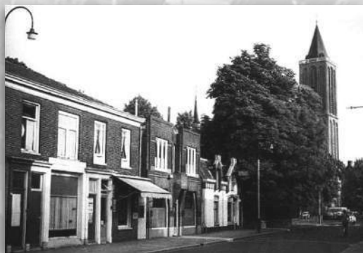
De Scapinogronen met rechts (witte gevel) het allereerste gemeentehuis

Dat werd ons eerste optreden als toekomstig planoloog. Opgetogen verlieten wij na anderhalf uur de B&W-kamer. Goudappel had naar onze mening echt te weinig steekhoudende tegenargumenten.