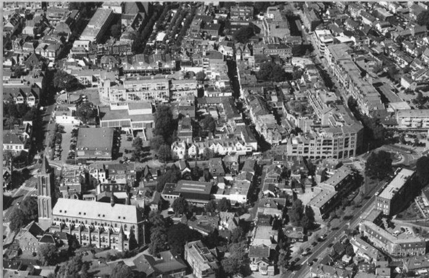
Centrum van Bussum anno 2009

minder dicht geworden. Niettemin is veel waardevolle bebouwing verdwenen: de markante villa's op de Olmen en een aanzienlijke hoeveelheid markante gebouwen aan de Veerstraat en de Brinklaan.