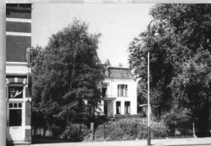
Villa de Olmen, waar nu de Olmenlaan loopt

Het Centrumplan was ontworpen door Stedebouwkundig Bureau Wissing, in overleg met een commissie van deskundigen en een Stuurgroep waarin het gemeentebestuur en projectontwikkelingsmaatschappij Empeo zitting hadden. Empeo had zich inmiddels een flinke positie