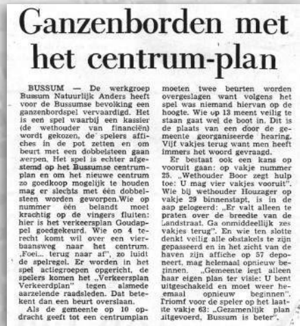
Spelregels bij het ganzenbordspel

Het alternatief van de Werkgroep 'Bussum NATUURLijk Anders' is simpel: de werkgroep geeft per plandeel nauwkeurig aan wat ook mogelijk zou zijn. Zij kiest voor een andere benadering: kleinschalig, meer groen, geen sloop, wel renovatie, geen of weinig kantoren, meer culturele voorzieningen, versterking van het winkelbestand, meer woningen in het centrum, minder ingrijpende verkeersoplossingen, beter openbaar vervoer, en plannen afstem-