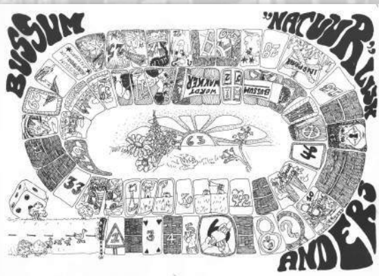
Ganzenbordspel 'Bussum NATUURLijk anders'

Inmiddels is het centrumplan bijna klaar. De bevolking bevindt zich precies op het aantal dat door de werkgroep was voorspeld: geen 40.000 maar 30.000. Over het verkeersplan is anno 2009 nog steeds discussie, maar de grote lijnen zijn gerealiseerd. De inzichten op gebied van verkeer en bereikbaarheid zijn veranderd. Uiteindelijk is de vierbaansweg dwars door het centrum er niet gekomen en de weg achter Marienburg wel. Een situatie als in Hilversum (Schapenkamp) kon worden voorkomen. Er zijn aanmerkelijk minder woningen gesloopt dan in de oorspronkelijke plannen. De hoeveelheid winkels en kantoorruimte is teruggebracht en de bebouwing is