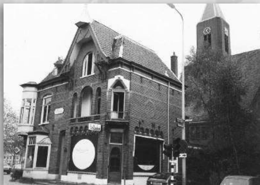
Op deze plek staat nu de Openbare Bibliotheek

Op 14 juni 1973 behandelde de Raad het plan. Met alleen de stemmen van PSP en PPR tegen werd het verkeersplan van de gemeente goedgekeurd, evenals de kredietaanvraag om de onteigeningen langs het tracee te beginnen. Wel kreeg het college opdracht van de hele Raad "de jongens [wij dus] nog eens met de professor [Goudappel] te laten stoeten". De publieke tribune was overvol. De aanwezigen uit allerlei hoeken van Bussum waren verbijsterd en razend. Direct na de vergadering verdwenen de raadsleden. Er was geen ruimte meer voor toelichting en gesprek. Daarmee was een stevige basis ontstaan voor de actie die vanaf dat moment tegen Verkeersplan zou beginnen. Veel Bussummers waren vastberaden de uitvoering van dit plan tegen te gaan.