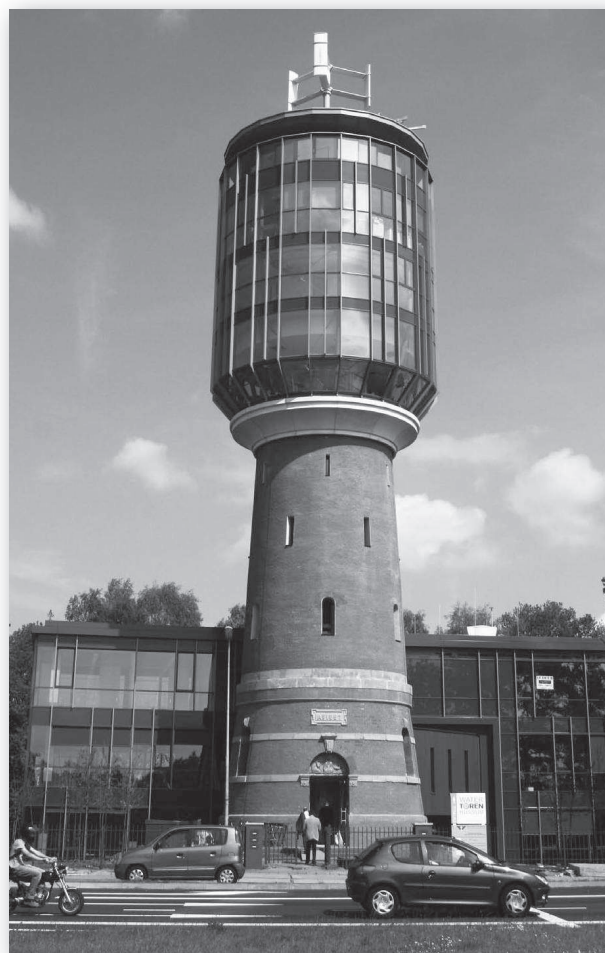
De watertoren op 1 juni 2010

De hoogste score in Nederland tot nu toe werd gehaald bij het kantoor van Rijkswaterstaat in Terneuzen, dit heeft een MIG van 323, daarna gevolgd door het kantoor van