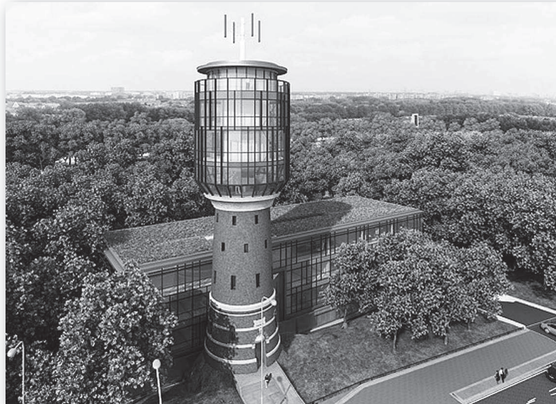
Artist impression van het complex

Dat betekent dat al het eigen afvalwater, inclusief fecaliën, geheel zelf gezuiverd wordt. Het pand heeft derhalve geen riolaansluiting. Het afvalwater wordt gezuiverd door middel van een helofytenfilter. Het filter is bouwkundig geïntegreerd en vormt een architectonisch element in het gebouw. Het zuivere water dat daar weer uitkomt, wordt hergebruikt voor de toiletspoeling van alle toiletten in het gebouw. Daarmee wordt 80% van het drinkwaterverbruik gespaard en ontstaat er een kleine waterkringloop met een geringe aanvulling voor drinkwater van het waterleidingbedrijf. Op deze schaal is een helofytenfilter in Europa nog niet toegepast. Het toont aan dat het zuiveren van water heel goed biologisch en ecologisch in projecten is te realiseren.