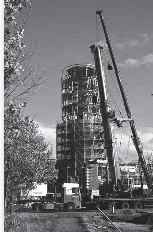
Het hijsen van de stalen kop