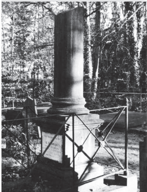
afb. 2c: Neoclassicistisch grafmonument uit 1887 met zuil