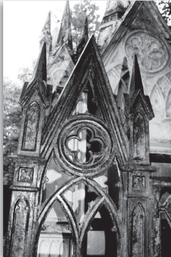
afb. 2b: Neogotische versieringen op het grafhek rondom de grafkapel

Verder staat er op de begraafplaats een grafmonument uit 1887 in neoclassicistische stijl. De vorm van de afgeknotte zuil is afgeleid van de tempelzuilen uit de Oudheid (zie afb. 2c) en symboliseert het afgebroken leven.