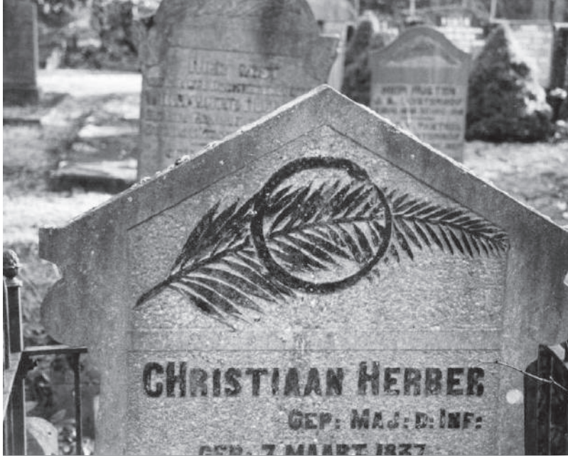
De slang met een palmtak op een stèle. De slang die in zijn eigen staart bijt is een vaak voorkomend symbool op grafmonumenten, als teken van de kringloop van dood en leven