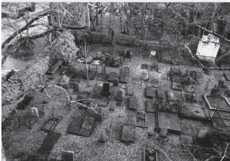
afb. 3: Het oudste gedeelte van de begraafplaats: een zerkenvloer

Doordat de begraafplaats volgens de lijnen van een Latijns kruis is ontworpen, heeft de inrichting in de 19e eeuw plaatsgevonden in de vakken aan beide zijden van de hoofdas, die loopt van het toegangshek naar het baarhuisje. De eerste begrafenissen hebben plaatsgevonden in het linkervak. Omdat men gewend was te begraven in kerken, zijn de eerste grafmonumenten dan ook zerken (liggende grafstenen). Het linkervak heeft daardoor enigszins het aanzien van een kerkvloer (afb. 3).