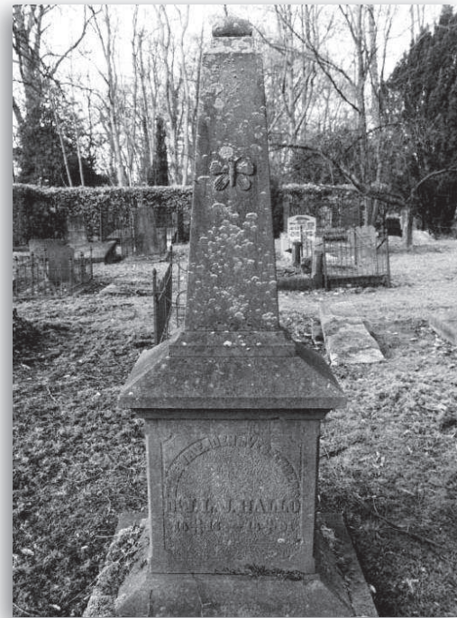
afb. 2e: De enige obelisk op de Oude Begraafplaats van Naarden

Het graf is afgezet met een hek in dezelfde stijl. De gekruiste spijlen worden gemarkeerd door een rozet en op de hoeken staat een pijnappel. De pijnappel is een symbool van de onsterfelijkheid (afb. 2d).