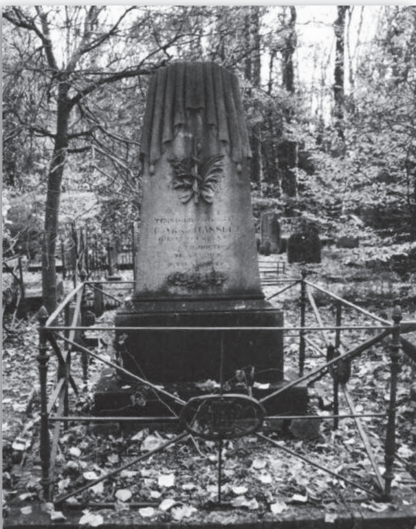
afb. 5a: Overdadig gebruik van symbolen

Het andere christelijke symbool op dit grafmonument, de lelie, wijst op reinheid en zuiverheid. Christus noemt deze bloem een voorbeeld van eenvoud en godsvertrouwen (Mattheüs 6:28). Beide tekens uit de flora omstrengelen als het ware de esculaap, het beroepsteken voor een arts. Het laat zich raden wat - naast zijn burgemeesterschap - het beroep is van degene, voor wie dit monument is opgericht.