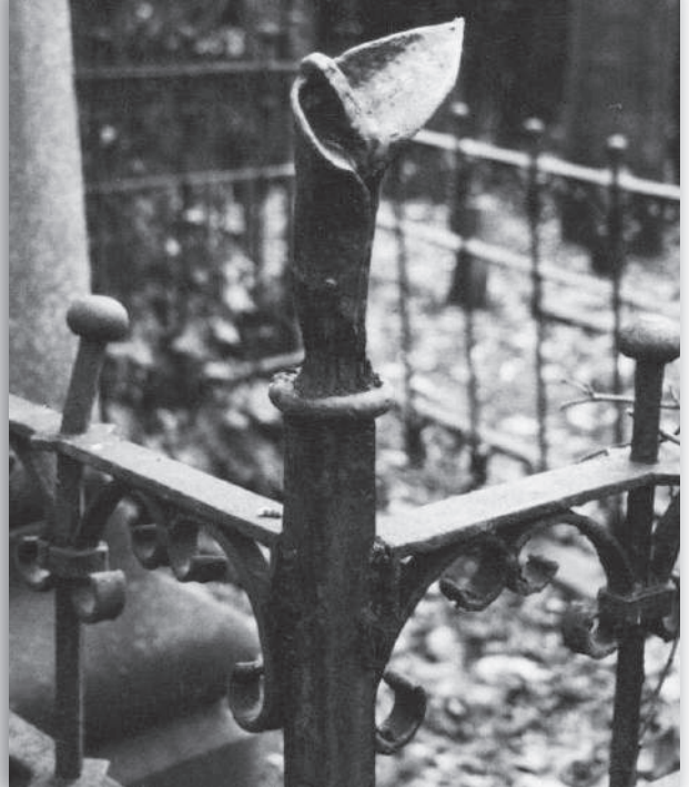
Een gestileerde lelie op een grafhek

Aan de voorkant van het grafhek staat een gevleugelde zandloper. Dit bijzondere funeraire teken komt op meer graven van de Oude Begraafplaats van Naarden voor. De zandloper of uurglas duidt op de verlopende tijd en de kortstondigheid van het leven. De vleugels aan weerszijden van de zandloper zijn niet identiek. Een is van een adelaar en de ander van een vleermuis. Een zandloper met deze beide vleugels geeft de overgang aan van dag naar nacht, van leven naar dood (afb. 5b).