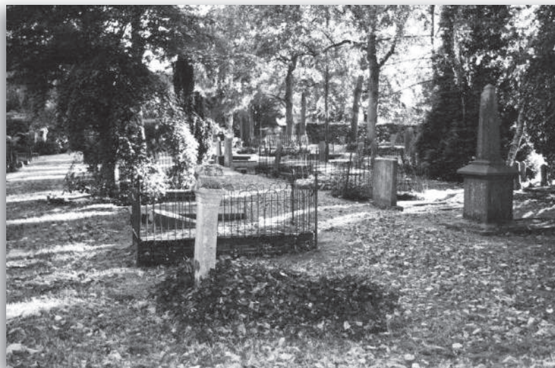
afb. 4b: Een impressie van het 19e-eeuwse deel van de Oude Begraafplaats van Naarden