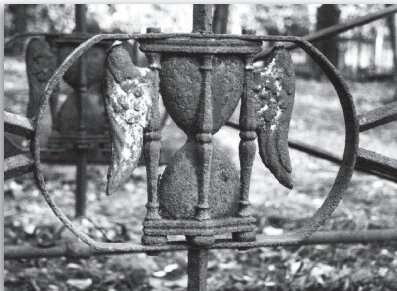
afb. 5b: Detail van grafhek met geveulegde zandloper