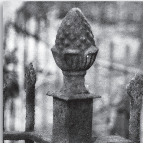
afb. 2d: Grafhek, voorzien van een pijnappel