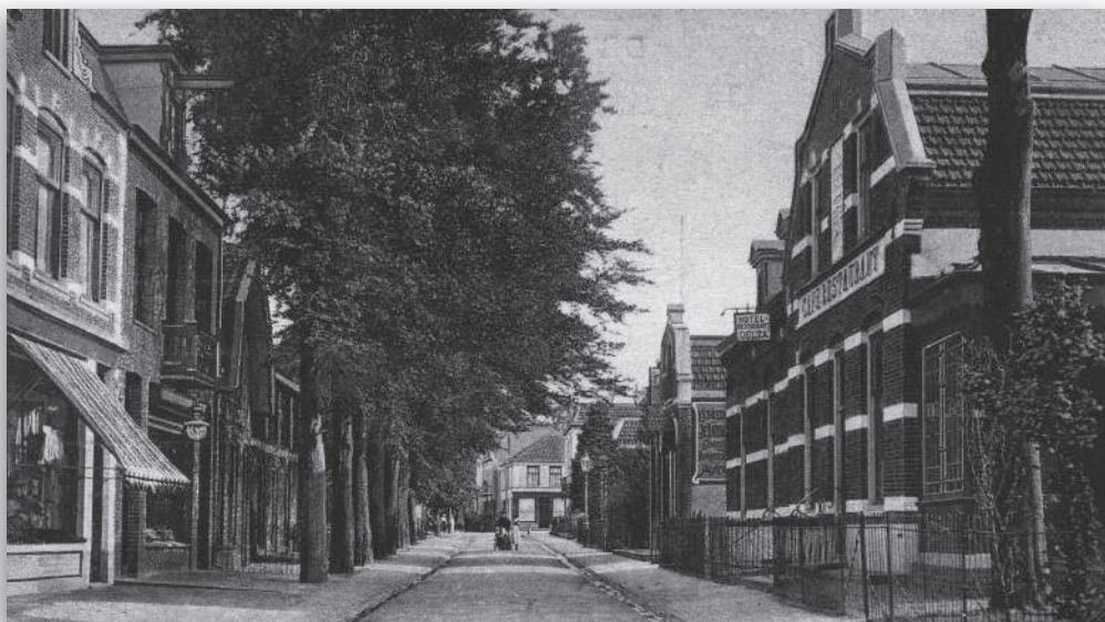
Rechts van de Brinklaan staat café-restaurant 'Delta' op de hoek met de Veerstraat, omstreeks 1910.

De eerste toneelvereniging, 'Nut en Genoegen', die in 1879 werd opgericht, was geen lang leven beschoren. Zij gaven in november 1879 hun eerste optreden. Daarna viel het doek en werd er niets meer van hen vernomen.