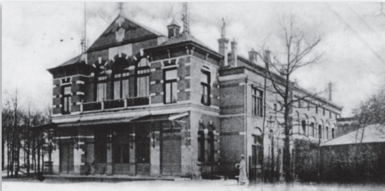
Het oude concertgebouw Concordia, geopend op 17 november 1897. Door brand verwoest op 27 april 1930.

Zes jaar later werd de draad weer opgepakt. De toneelvereniging 'Vooruitgang zij ons doel', die dat jaar was opgericht, gaf op 29 november 1886 haar eerste uitvoering. Een volgende vermelding in de krant is als zij op 21 november 1892 optreden. Opmerkelijk is dat zij dan genoemd worden tezamen met een andere toneelvereniging 'Onder Ons', die daarna geruisloos verdwijnt.