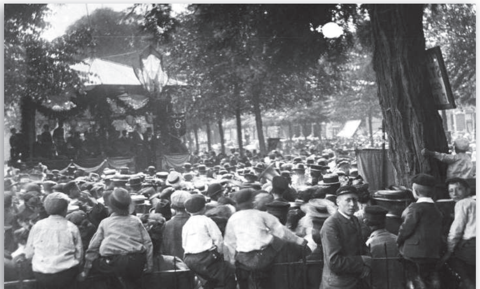
Crescendo geeft een concert in de muziektent op de Brink omstreeks 1905 onder grote publieke belangstelling. Gezien vanuit de tuin van Vroom. Op de acacia (rechts) hangt een bord met het opschrift "Stilte gedurende de muziek".