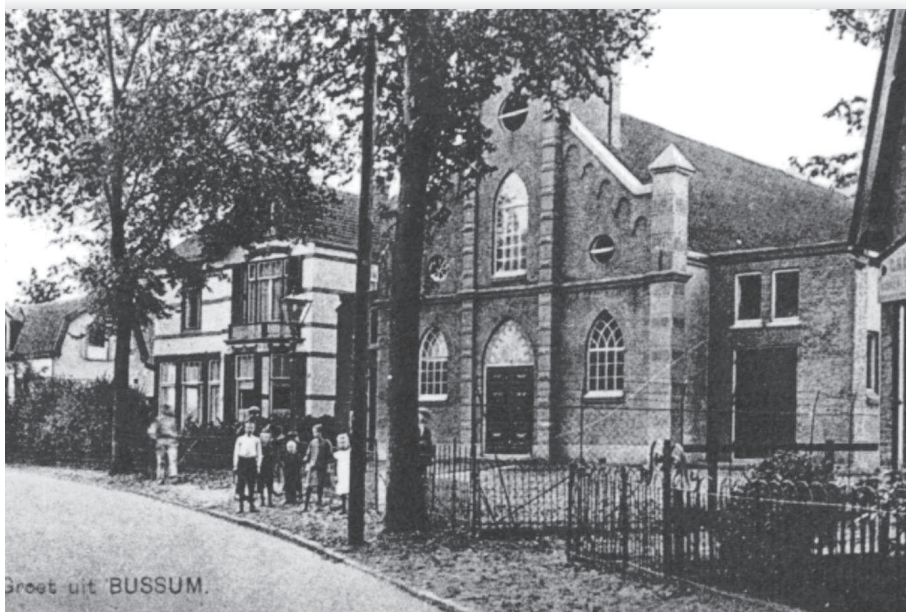
Kerk in oorspronkelijke staat rond de eeuwwisseling