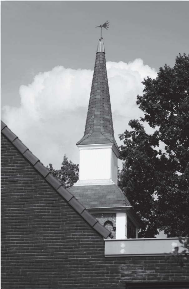
Zicht op de vernieuwde toren met 'windvogel' vanaf de achterzijde