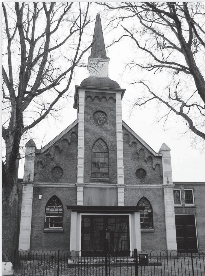
Kerk voor de verbouwing

Dan start onze lange weg om de bestemming te wijzigen van maatschappelijk naar wonen. Zonder ervaring is dit een onmogelijke opgave, want de regelgeving is zeer complex en omvangrijk. We hebben ons daarom laten bijstaan door een bureau dat een compleet bestemmingsplan voor ons schreef en allerlei wet- en regelgeving nakeek. De gemeente was voorstander van ons plan maar beperkte zich tot een toetsende rol en zag geen kans de procedure korter te laten duren dan een klein jaar. Voor ons was dat frustrerend, maar achteraf ook wel plezierig omdat we daarvoor veel tijd hadden om over onze plannen na te denken. En dat bleek geen overbodige luxe omdat het project toch ingewikkelder is dan je van tevoren denkt. Heel positief waren de reacties van de buurtbewoners die ons het idee gaven dat we op de goede weg waren.