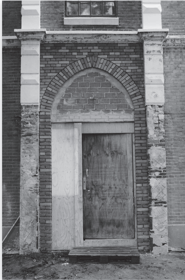
De voordeur wordt in de – bijna – oude staat hersteld