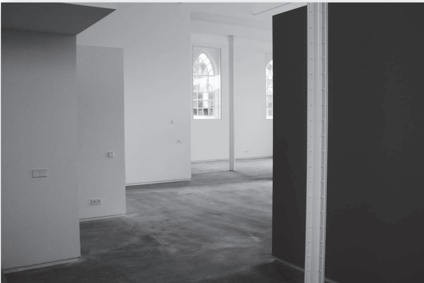
De vernieuwde binnenkant