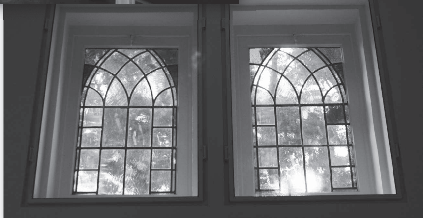
Deze glas in lood ramen kwamen weer tevoorschijn, na 45 jaar onzichtbaar te zijn geweest