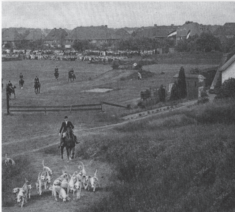
Concours hippique, 1936

De eerste jaren veranderde er weinig, totdat de gemeente Bussum in april 1930 de op haar