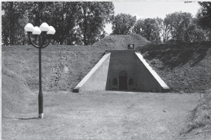
De gerestaureerde ingang van de poterne

Ook moest het terrein rondom het fort ontdaan worden van begroeiing, om vrije zicht- en schootsvelden te krijgen. Voor deze taak konden burgerarbeidskrachten worden gevorderd, compleet met gereedschap en bespande wagens voor de afvoer van omgehakte bomen en takken, voor zover deze niet konden worden gebruikt in het fort.