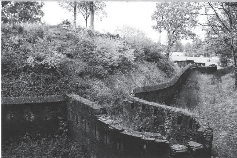
De ruïnes van de linkerflank (coll. HKB)

aan de flanken een meter lager. Onder de wal loopt een gemetselde gang, de poterne, onder de borstwering door naar een stenen uitbouw aan de voet van de wal: de caponnière. Deze caponnière heeft aan de frontzijde twee zijingangen naar de walgang. In de caponnière werden de appels gehouden. Zij was afwachtingsruimte en wasplaats. Indien nodig kon zij ook als onderkomen dienen voor 42 man.