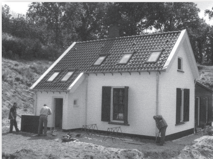
De herbouwde wachterswoning

Het onderhoud, dat de terugkeer van verval moet voorkomen, is sindsdien opgedragen aan de stichting Herstelling Gooi- en Vechtstreek (Tomin-groep). Deze stichting heeft als doel, mensen die moeilijk plaatsbaar zijn in de normale arbeidsmarkt, via een leer- en ervaringstraject geschikt te maken voor (her)integratie in het arbeidsproces.