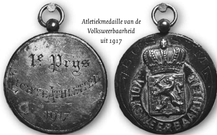
Atletiekmedaille van de Volkswaarheid uit 1917