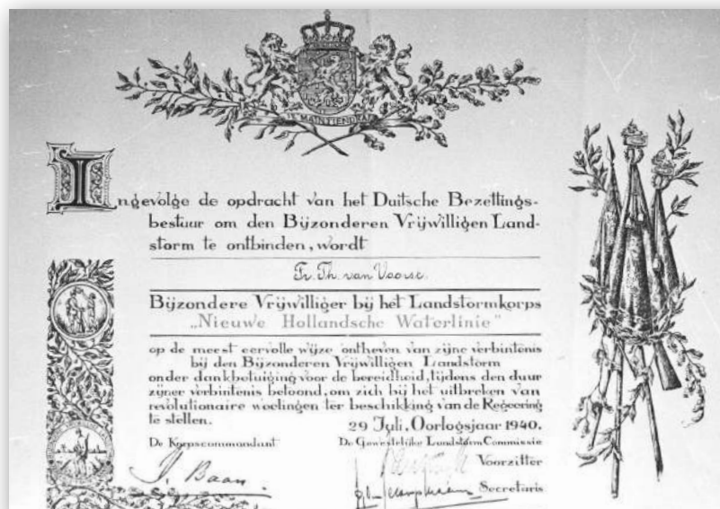
Ontslagcertificaat bij de ontbinding van de Bijzondere Vrijwillige Landstorm

Hoewel het achteraf gezien een storm in een glas water bleek te zijn geweest, had het toch tot gevolg dat een groot aantal landstormplichtigen zich spontaan aanmeldde voor actieve dienst. Alleen in Bussum al kwamen in november 1918 ruim tweehonderd aanmeldingen binnen. Zij vormden het korps Bijzondere Vrijwillige Landstorm binnen het Nederlandse leger. Kort na de Duitse inval moest op last van de bezetter zowel de Vrijwillige als de Bijzondere Vrijwillige Landstorm per 29 juli 1940 worden ontbonden.