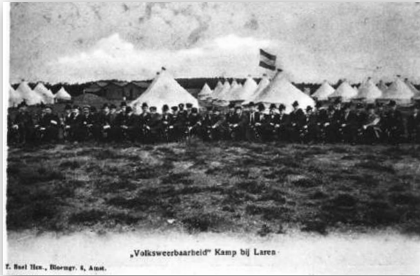
'Volksweerbaarheid' Kamp bij Laren

De eerste schietoefeningen, op de korte baan, hielden zij vanaf eind april 1902 in het zaaltje van café Delta aan de Brinklaan. Op Werk IV kregen ze de beschikking over een schietbaan van 35 meter. Veldoefenin-