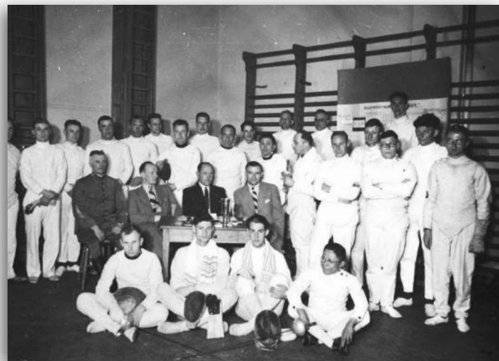
Een groep schermers van GSC, NSC, KOOS en Burgerwacht, ca 1936. Op de achterste rij staan 5 leden van Burgerwacht, te weten v.l.n.r. de 5e, 6e, 15e, 17e en 29e. (KOOS = Korps Onder-Officieren Schermclub)

De eerste veertig jaar van de twintigste eeuw geven vanuit de bevolking een duidelijke behoefte te zien aan meer veiligheid. Op vrijwillige basis gaf men zich op voor weerkorpsen op lokaal niveau. Achtereenvolgens waren dat de Volksweerbareid, tussen 1900 en 1918; de Vrijwillige Landstorm, met een lokale afdeling tussen 1922 en 1940; de Bijzondere Vrijwillige Landstorm tussen 1918 en 1940; de Burgerwacht tussen 1919 en 1940. De eerste drie konden als de nood aan de man kwam bij het Nederlandse leger worden ingelijfd. De Burgerwacht kon alleen optreden om de plaatselijke politie te ondersteunen.