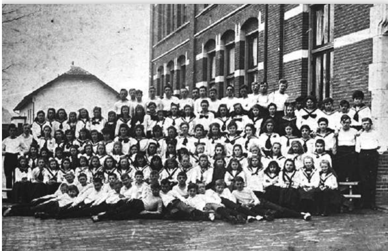
De gymnastiekafdeling van de Volkswaarheid op het schoolplein van de Prins Hendrikschool

In 1913, op 28 april, kondigde de regering de zogenaamde Landstormwet af. De Landstorm was een organisatie waarin 'iedere militieplichtige werd opgenomen die a) van de dienst bij de militie was