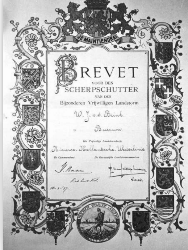
Scherpschutterbrevet van de Bijzondere Vrijwillige Landstorm afdeling Bussum

Het einde van de Eerste Wereldoorlog betekende tevens het einde van een aantal keizerrijken, zoals