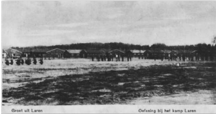
Oefenen van de Vrijwillige Landstorm met de afdeling Laren bij Kamp Laren

vrijgesteld wegens broederschap of halfbroederschap of kostwinnerschap; b) ieder die na volbrachte dienst bij de militie of bij de landweer uit de dienst is ontslagen; c) ieder niet vallende onder a), die dienst heeft gedaan bij de zeemacht, het KNIL, het leger, en bij het verlaten van de dienst zich in Duitsland of België heeft gevestigd; d) ieder die tot een vrijwillige verbintenis bij de Landstorm is toegelaten'.