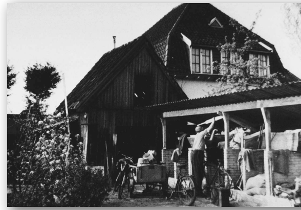
Het terrein Eslaan 5. Op de achtergrond het koetshuis van een naburige woning. Daarvoor de schuur en de granietbakken.