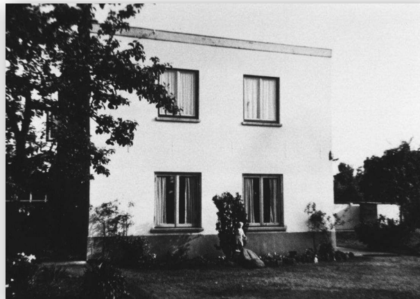
Het huis Eslaan 5 na de verbouwing

te gaan uitoefenen. Het tijdstip van zijn emigratie naar Nederland was geen toeval. De grote economische crisis had ook in Friuli toegeslagen. De messen- en scharenindustrie werd ernstig getroffen en de werkloosheid in de streek was aanzienlijk. Niet alleen de mensen in de metaalnijverheid verloren hun baan, de daardoor veroorzaakte inkomensdaling had ook haar uitstraling naar andere sectoren van bedrijvigheid, zoals de bouw. De terrazzowerkers in de streek werden geconfronteerd met een inzakkende woningbouwmarkt. Zij werden in hun voortbestaan bedreigd en velen zochten elders hun heil. Het is daarom wel zeker deze ontwikkeling die de 41-jarige Antonio Tramontina heeft bewogen via Duitsland naar Nederland te trekken, hoewel ook hier sprake was van een recessie.