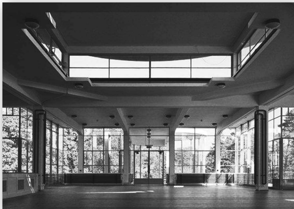
De entreehal van sanatorium Zonnestraal, met de deur de fa. Tramontina vervaardigde vloer