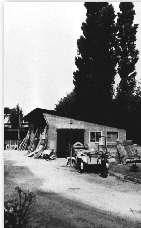
De opslag bij Eslaan 5