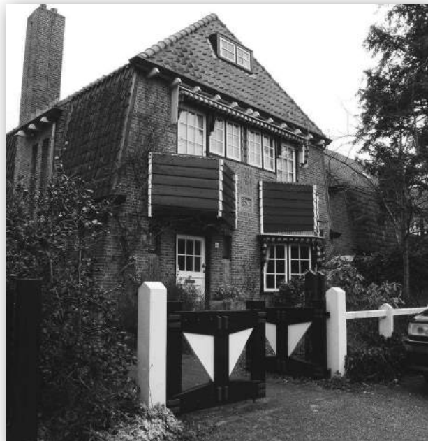
Willemslaan 40.

Achter de hoge heg is de bovenkant te zien van een, in een royale tuin gelegen, rietgedekt landhuis met klokkenstoel. Het rijksmonument 'Meentwijk' is in 1912 ontworpen door architect K.P.C. de Bazel. Daarachter ligt het terrein van de Nierstichting, dat grenst aan het weiland dat binnen enkele jaren deel zal uitmaken van de natuurcorridor tussen het Naardermeer en de Gooise heide. Aan de rand van het weiland staan monumentale beuken en eiken. Een zijweg van de Groot Hertoginnelaan is de Regentesselaan. Op de splitsing van de Prins Mauritslaan en de Regentesselaan staat een grote ceder van ongeveer 100 jaar oud.