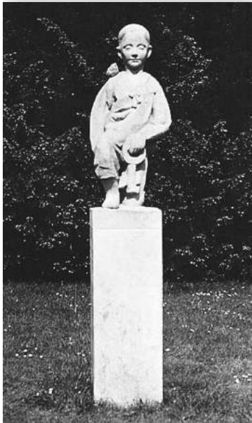
De Kleine Johannes bij de Kom van Biegel.

enkele villa's waaronder Villa Dennekamp. In deze villa woonde de schrijver Frederik van Eeden tot 1898. Daarom werd het beeld van zijn romanfiguur 'De kleine Johannes' in het park geplaatst op een plek ter hoogte van de toen al afgebroken villa van Van Eeden. Het park wordt omzoomd door diverse boomsoorten: linde, taxus, treurwilg, watercypres, catalpa, beuk, ceder, zilversdoorn. Twee gebouwen bij de kom waren hotels/pensions: Beerestein (aan de westkant, nu kinderopvang) en Edinoor (oostkant, nu een kantoorvilla). Ten zuiden van de Kom lag de zandafgraving De Zandzee, waar