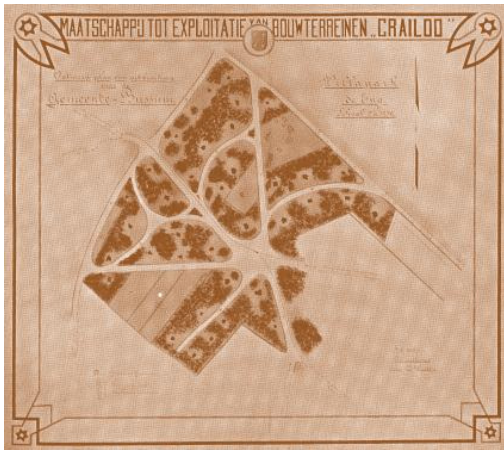
Ontwerp plan uitbreiding villapark de Eng in Bussum

lingsplekje, om hem van het prachtige vergezicht over de akkers op het oude Bussum te doen genieten! Laat U niet weerhouden door de vrees, dat gij daar Uw leven minder geriefelijk zult moeten inrichten dan in de stad; voor behoorlijke verlichting (gas- of electrisch licht) zal worden gezorgd, en wat het drinkwater betreft, uit Uw eigen terrein kan dit volkomen zuiver worden opgepompt: althans, wanneer gij niet de voorkeur daaraan geeft, Uw perceel aan te laten sluiten aan de leiding, die in de toekomst door of van wege onze Maatschappij U van uitstekend drinkwater zal kunnen voorzien.