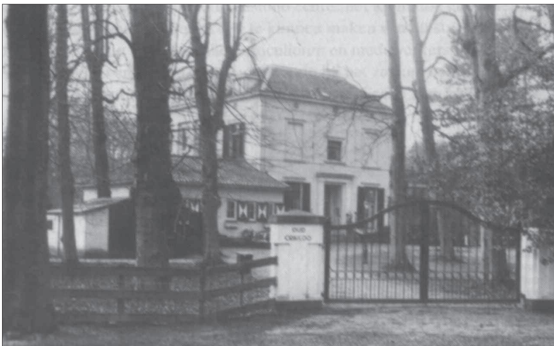
Toegangshek Landgoed Crailoo circa 1900

Dit artikel is met toestemming overgenomen uit 'Deelgenoot', het blad van de Historische Kring Blaricum, zomer 2012. Het ter inzage gekregen exemplaar van de brochure is in het bezit van de heer Gerbe van der Woude.