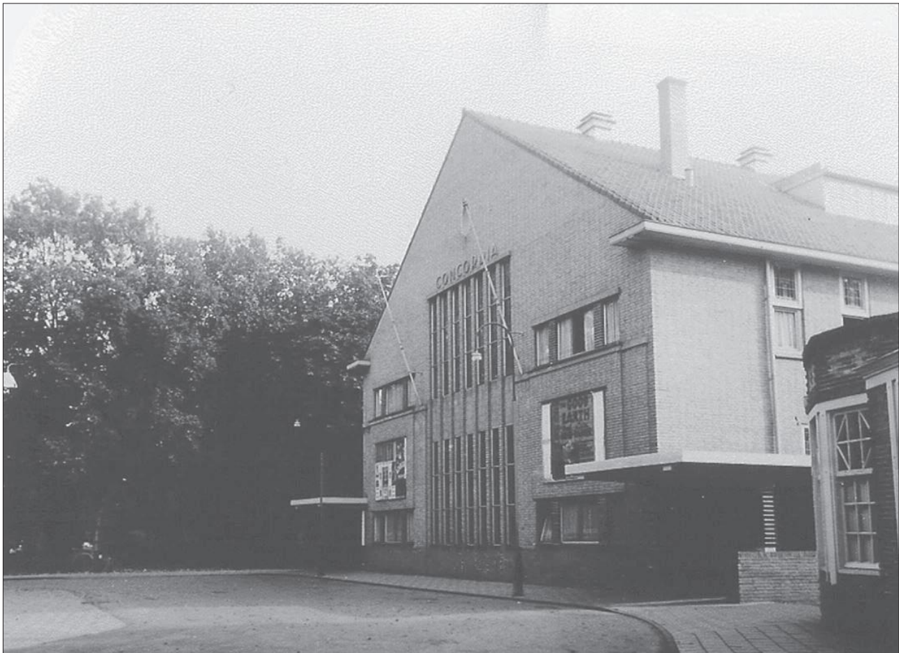
Het nieuwe Concordia. Foto uit 1934