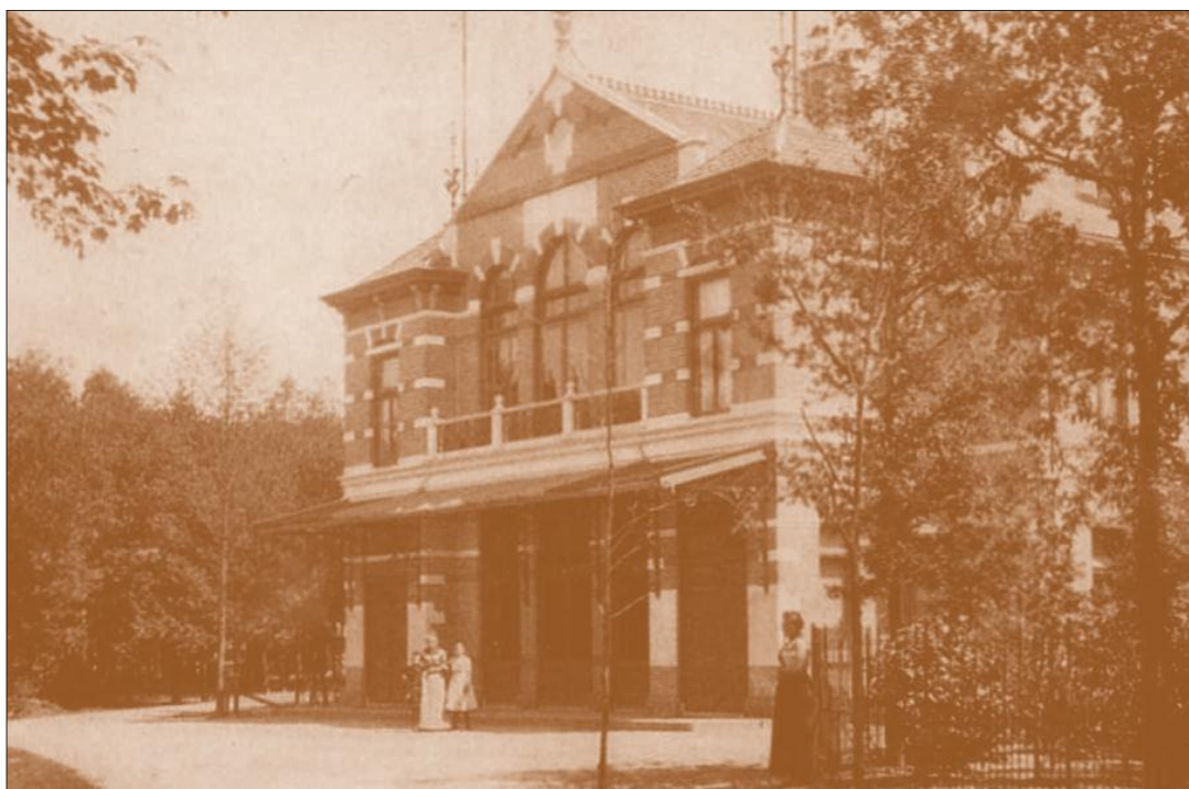
Concertgebouw Concordia

Op zaterdag 26 april 1930 organiseerde de Bussumse afdeling van het Rode Kruis een propaganda-avond in Concordia. Hiervoor pakte de hulpvereniging breed uit met een op Indische leest geschoeide manifestatie. Tot laat in de nacht, aldus de Bussumsche Courant van de maandag erop, 'heerschte er in Concordia's zalen jolijt en feestvreugde, muziek en dans; was daar een Indische sprookjessfeer getooverd.'