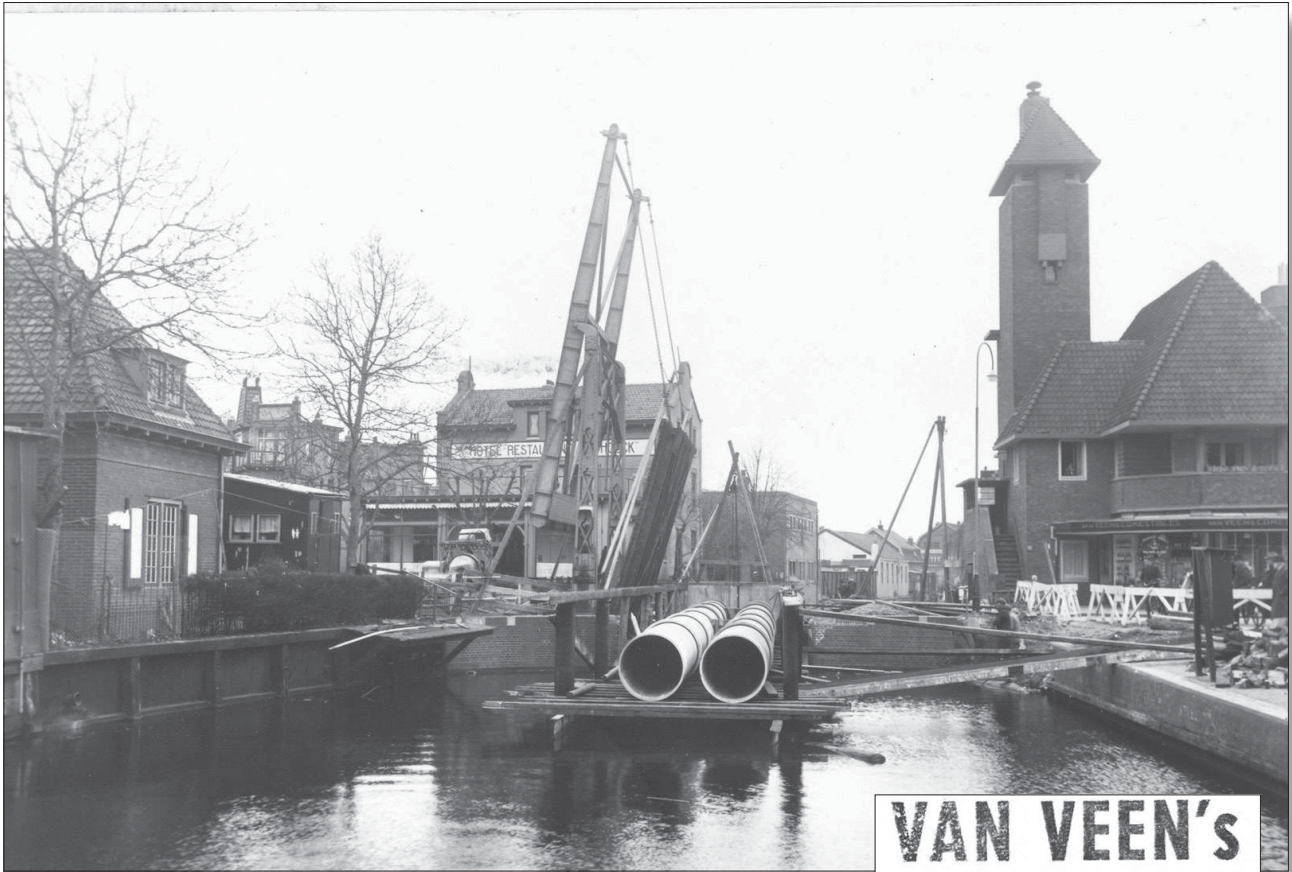
In 1940 wordt de ophaalbrug gesloopt en vervangen door een met 'duikers' doorlaatbaar gemaakte dam.