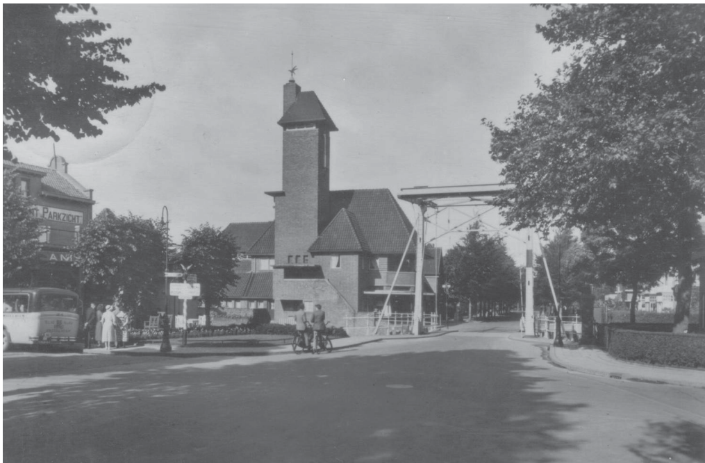
December 1928. De daklijn aan de achterkant loopt door in de stenen trap. Op de toren het gietijzeren ornament.