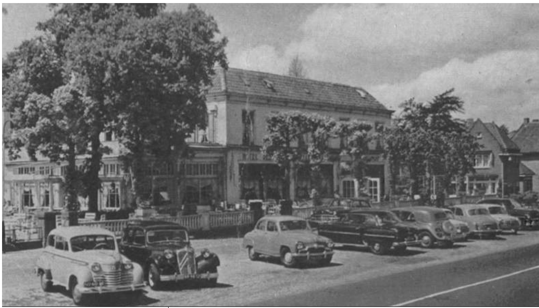
Hotel Jan Tabak, gezien in de richting Naarden, ca. 1955