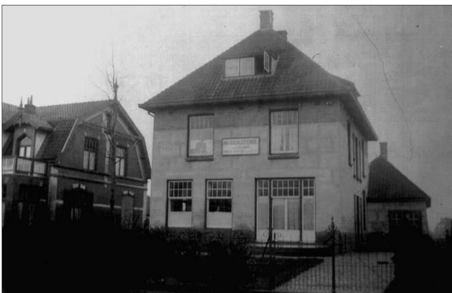
Huishoudschool, oorspronkelijke uitvoering, ca. 1921. Links nr. 56 van dubbele villa

van losse 'applicatiecursussen' een groot succes wordt: naaien, koken, strijken en kinderverzorging – vooral voor meisjes die willen gaan trouwen en zich daar op deze manier op voorbereiden. In deze tijd van snelle emancipatie van de arbeidersklasse voorziet de school duidelijk in een behoefte. Er waren toen ook al Open Dagen: die van 1923, slechts twee jaar na de start van school, trekt al 900 bezoekers. Er wordt tot in de trapportalen lesgegeven.