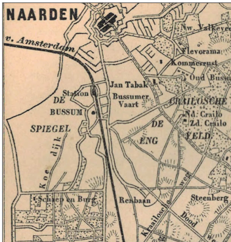
Renbaan onder midden. Detail van kaartje Gooiland uit: Wandelingen door Nederland door J. Craandijk (1882).

Huizerweg 54 - 1402 AD Bussum Telefoon 035 691 29 68 www.historiekringbussum.nl hist.kring.bussum@planet.nl