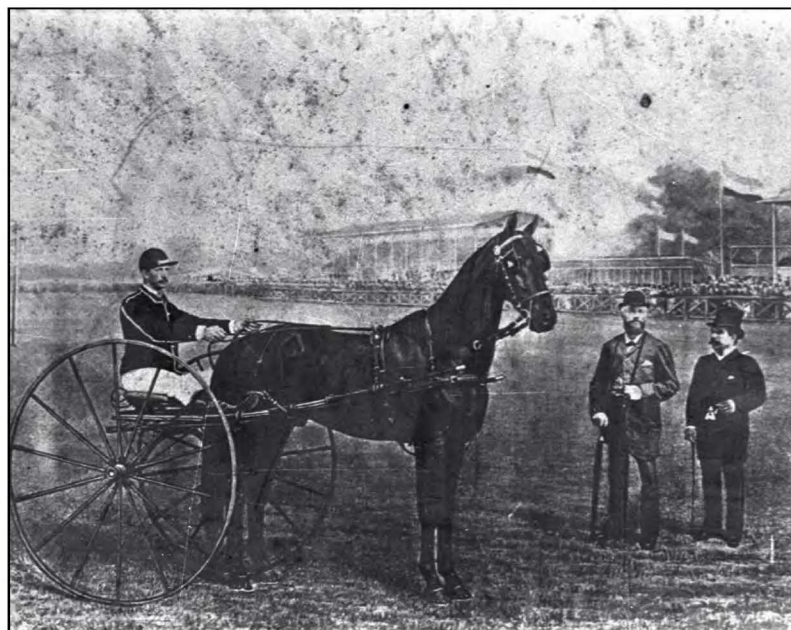
Koning Willem III (met bolhoed) bezoekt in 1881 de wedrennen. Naast hem burgemeester Langerhuizen

Meer over renbanen in Bussum vindt u in het Bussums Historisch Tijdschrift nr. 2, 2008. Te koop bij de Historische Kring Bussum.