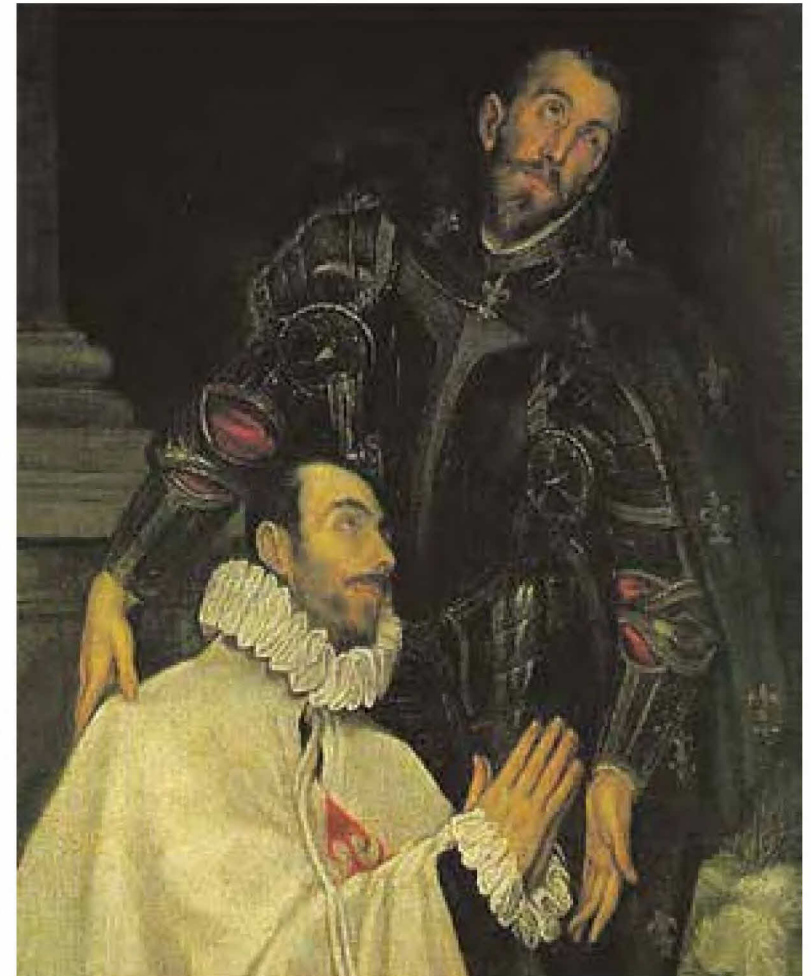
El Greco: Romero en St. Julian (Prado Madrid)

land uitgestuurd. Zijn taak werd het de opstandige Hollanders tot de orde te roepen. Vanwege zijn brute wijze van optreden kreeg hij