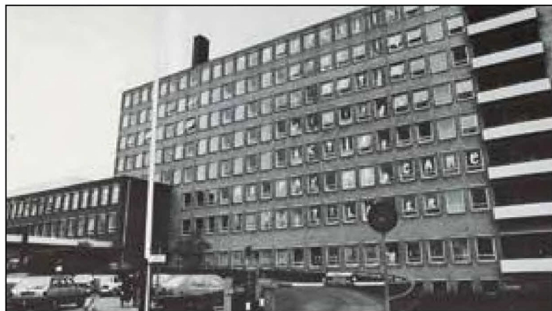
Het hoofdgebouw uit 1966 aan de Nieuwe Hilversumseweg eind jaren '80.

Dé grote man van het ziekenhuis is Anton Dreesmann (1854-1934) geweest. De oprichter van V&D, die vlak bij het ziekenhuis woonde, was initiator, organisator en financiële weldoener. In 1924 vroeg Dreesmann voor zijn zeventigste verjaardag een ziekenwagen aan zijn kinderen, die hij aan het ziekenhuis schonk. De wagen (zie foto) was van het merk Minerva. Het was lange tijd de enige ziekenwagen in het Gooi. De auto had massieve banden, maar toen er klachten kwamen over het schok-