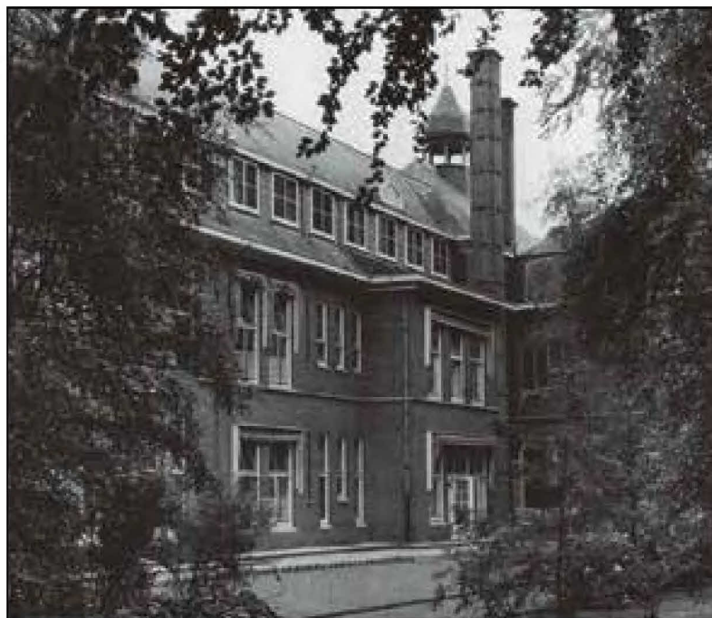
Achterkant van het ziekenhuis met het torentje van de kapel.

In 1910 werd de stichting Gerardus Majella opgericht. In 1911 werd aan de Iepenlaan de villa Spiegelheuvel als ziekenhuis in gebruik genomen en in 1916 werd het echte ziekenhuis gebouwd. Het was een groot terrein, dus bleef ruimte over voor een grote tuin met toen al oude beuken. De kapel voor de kloosterzusters kwam boven de hoofdingang aan de Iepenlaan. Het torentje van de kapel is het enige wat tot vandaag nog zichtbaar is. Het is na de sloop en de bouw van de huizen in 1996 als herinnering midden in het Majellapark geplaatst.