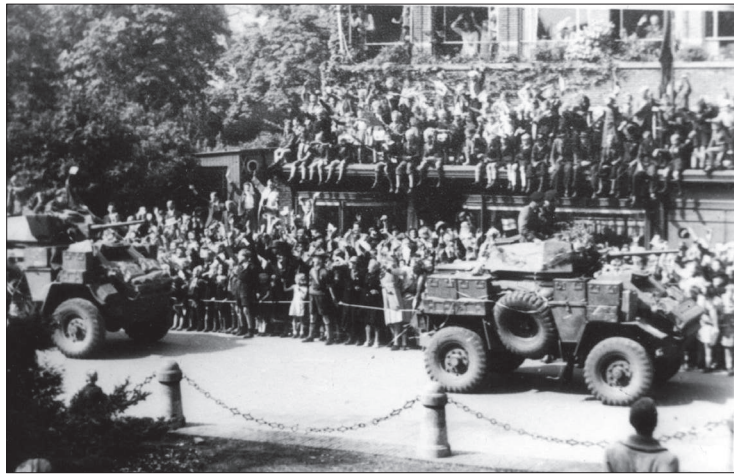
bevrijdingsfeest 1945 ter hoogte van het gemeentehuis