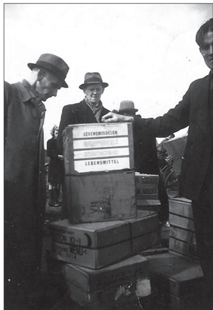
Boven en links: Voedseldropping op de hei, mei 1945

Op woensdag over acht naar de H. Mis. Om middag toe bereiden gemaakt voor de oude jaan avond vrijdag. Over de aan het bukken in ik heb een Huis aen sla. gemaakt. Om gehalen middag zijn wij beiden dus in den meer genest. Om 7 uur begon de pret. Eerst een spelletje 31 steen gespeeld en daar tussen door appelappels met jus gegeten met het siet om half twaalf de Huis aen sla. Ook hebben wij nog een uurtje gepraat. Om 12 uur zijn wij naar ons bed gegaan.