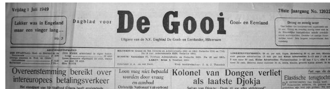
De Gooi- en Eemlander in 1949