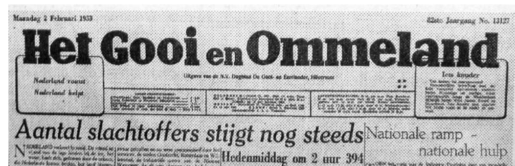
De Gooi- en Eemlander van 1950 tot 1956

ning voor het drukken niet meer betalen. Märckelbach in Bussum nam de krant over, een drukker die nota bene tijdens de bezettingstijd het naziblad De Zwarte Soldaat had gedrukt! Lezers en redacteurs waren woedend. In 1949 ging Gooische Klanken failliet. De laatste maanden was het een krantje van twee pagina's geworden.