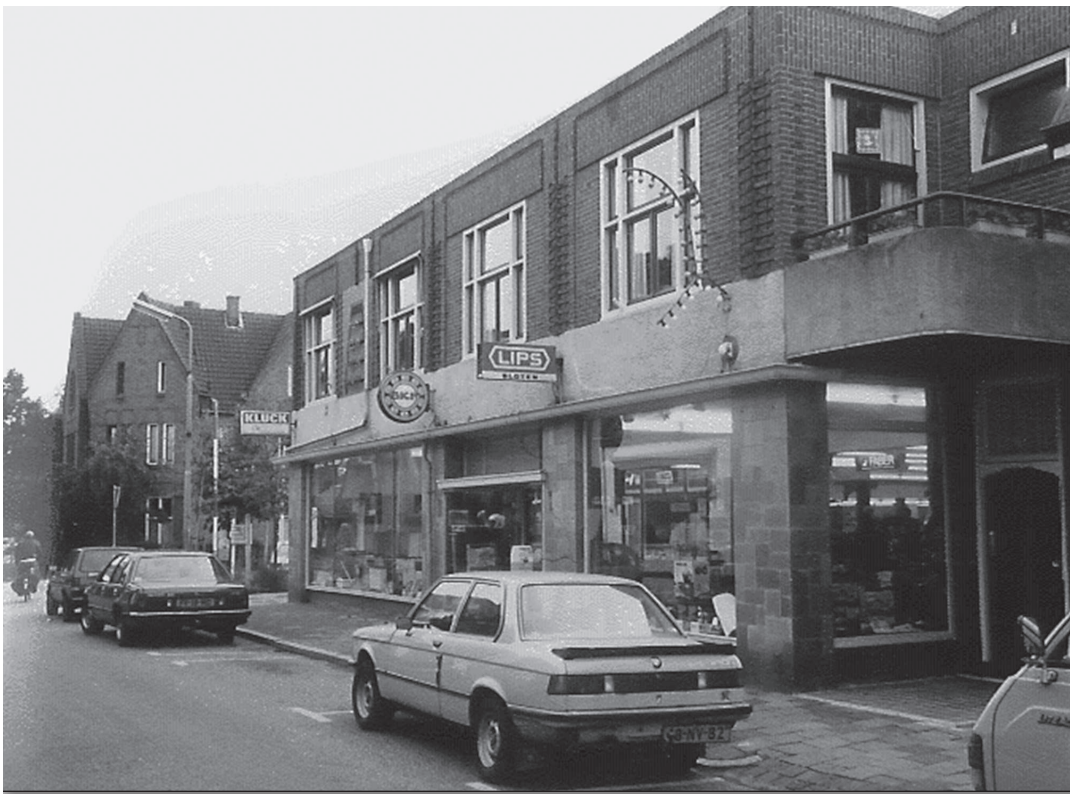
Kruising Kapelstraat / St. Vitusstraat, gezien richting Laarderweg. Vooraan rechts de deur naar nummer 42 van de woning boven de winkel. Daarnaast nummer 44 met de ingang van de ijzerwinkel van Klück.