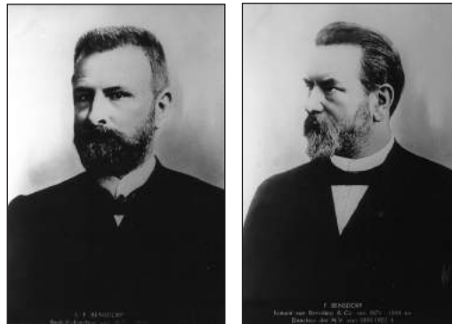
Links: Louis François Bendsdorp