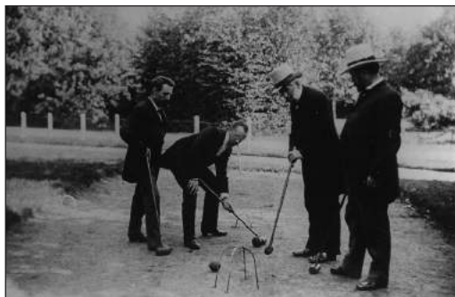
De firmanten van Bendsdorp bij een spelletje croquet op villa Gudelahove aan Nieuwe 's-Gravelandseweg 16. Datum opname 1890

En het blijft niet bij Bussum. In 1901 wordt in Kleef een cacao-fabriek in bedrijf gesteld en in 1907 komt er een fabriek in Wenen. Met de opening van een geheel vernieuwde cacao-fabriek in Bussum in 1906 is Bendsdorp uitgegroeid tot een modern en goed