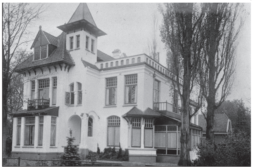
Boven: Villa Maracaibo anno 1901