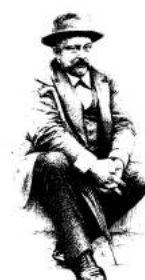
P.L. Tak, litho van Jan Veth. Uit het laatste nummer van De Kroniek, geheel gewijd aan (het overlijden van) Tak.

Van 1890-1893 trok de bij De Amsterdammer ontslagen journalist Tak (1848-1907) zich terug in Bussum om zich aan de studie van sociale onderwerpen te wijden. “Biedt zich in het praktische leven wat aan, waarvoor ik geschikt zou kunnen zijn, dan pak ik het gaarne aan, want ik ben veel meer aangelegd voor een praktisch dan een bespiegelend leven. Het uitoefenen van enig gezag over jongeren zou mij wel lukken” , schrijft hij aan Van Loghem, oprichter van de Groene Amsterdammer . Van Eeden tekent op 11 februari 1891 in zijn Dagboek aan: “Nog bij Tak zitten praten. Tak zo uitstekend, omdat hij het volmaakte 'bon sens'