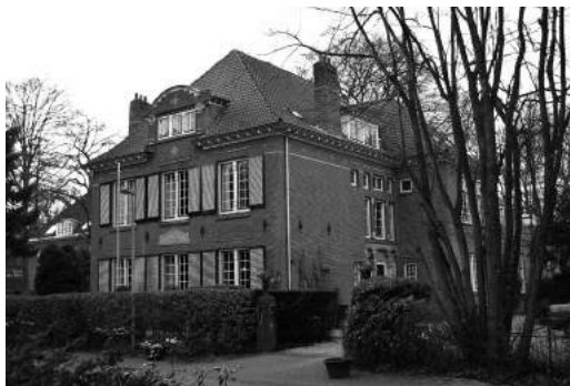
Villa Op den Akker, Parklaan 35.