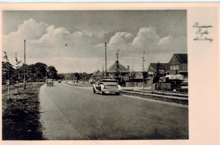
De Rijksweg richting Naarden met rechts enige gebouwen van het Blindeninstituut. Foto eind jaren 30.