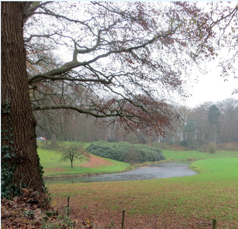
Afgezand landschap bij Flevorama.