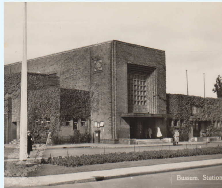
Station Naarden-Bussum omstreeks 1950.

Na de film en pauze houdt de Historische Kring Bussum haar jaarvergadering, waarbij ook niet-leden welkom zijn.