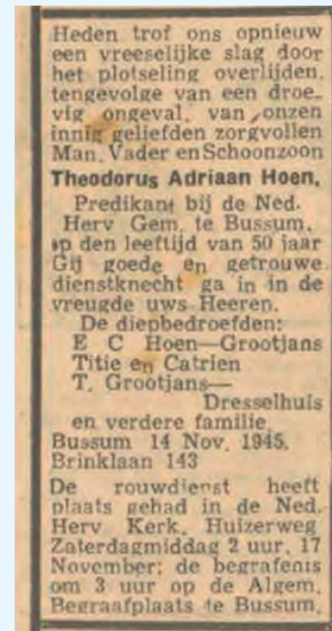
Rouwadvertentie in het dagblad De Nieuwe Nederlander van 17 november 1945.