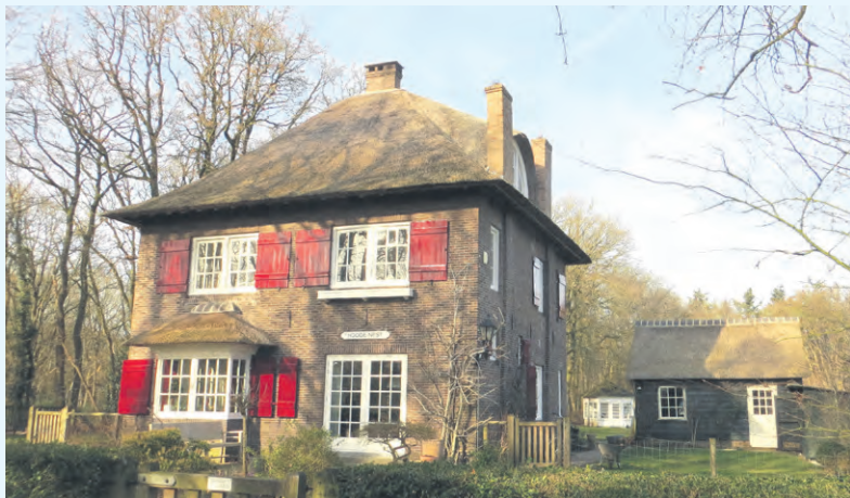
De villa in 2019

"Een door joden gerund landhuis vol onderduikers op juist déze plek in de bossen van Naarden heeft sowieso iets weg van een Trojaans paard: in 't Gooi wemelt het van de fascist. Met name in de villawijken van Naarden en Bussum zijn ze oververtegenwoordigd: het dubbele aantal van het landelijke gemiddelde. In Bussum zitten veel NSB'ers in villawijk 't Spiegel, en ook de mooie panden van Naar-