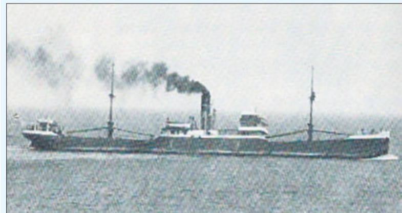
Het stoomschip Bussum (3636 ton) van Vinke & Co.

Dit artikel gaat over het koopvaardijship met de naam 'Bussum' van Rederij N.V. Houtvaart (Vinke & Co). De 'Bussum' kon tijdens de mei-dagen in 1940 uit Nederland ontsnappen, maar werd op 13 mei ten noorden van de het lichtschip Westhinder door een Duitse luchtaanval vrij zwaar beschadigd. Een Brits oorlogsschip slaagde er echter in de 'Bussum' binnen te slepen. Ruim zes maanden later zou het schip een vijandelijke onderzeebootaanval echter niet overleven.