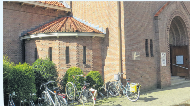
De buitenkant van de vml. doopkapel

Er is hier dus sprake van symboliek, aangebracht door architect Cuypers. Zo waren er ook zeven treden aangebracht voor het altaar. Dat is een symbolisch getal en duidt op volheid, compleetheid (vgl. de zeven dagen in de week) en op de dag van de Verrijzenis, de opstanding uit de dood van Jezus. Om veiligheidsrede-