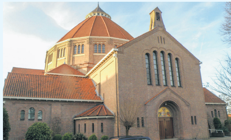
De Mariakerk te Bussum