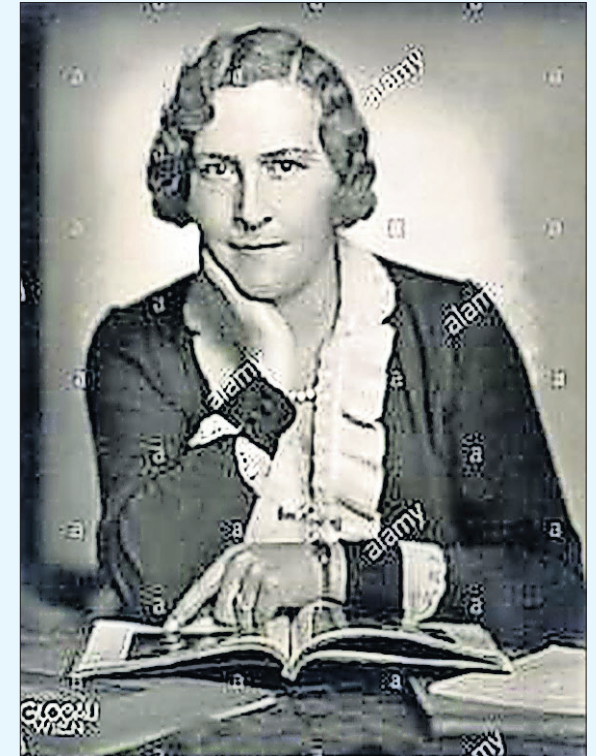
Jo van Ammers-Küller

me tijd daarna in het Spiegel in Bussum en bewonderde het nazisme. Uiteraard werd zij lid van de Cultuurkamer. Na de oorlog kreeg zij een schrijfverbod en moest haar koninklijke onderscheiding inleveren. Onder het pseudoniem Adriaan Hulshoff