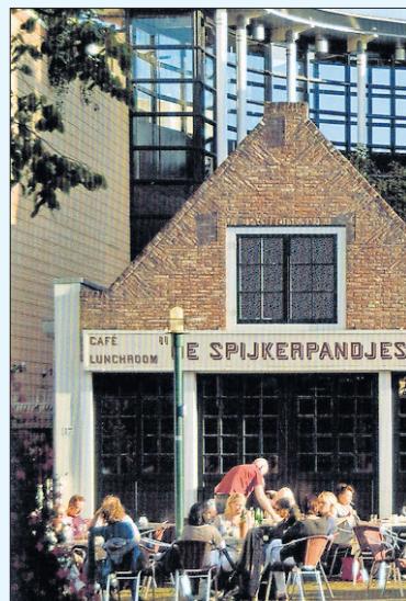
Een van de Spijkerpandjes.

zouden volgen, waaronder de eerste vierwielaangedreven zescilinder ter wereld.