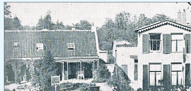
Links: Brinklaan 76; hier begint de G. Majellastichting in 1910.