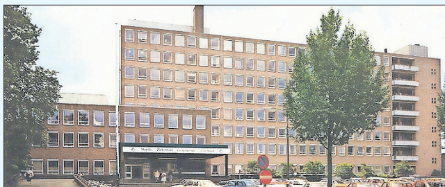
Het Majellaziekenhuis met de hoofdingang aan de Nieuwe Hilversumseweg 20. Tot 1990 in gebruik.