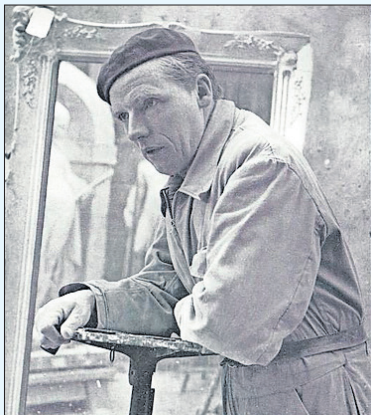
Mari Andriessen in 1938