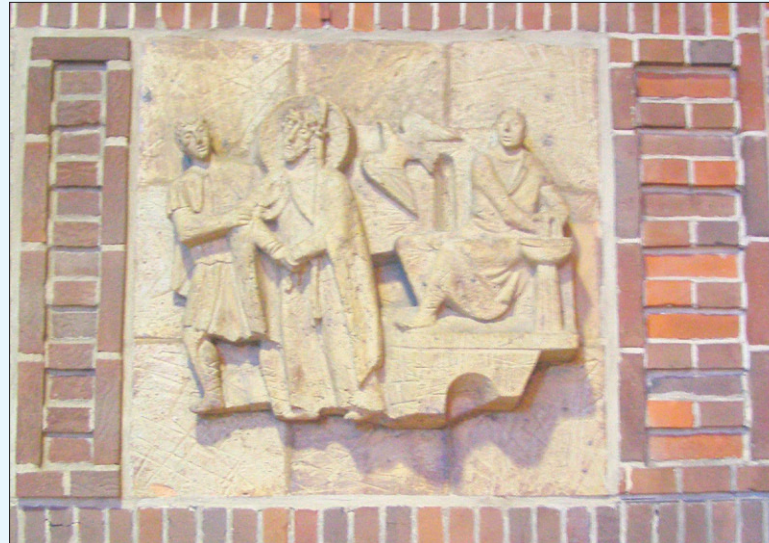
Eén van de kruiswegstaties in de Mariakerk