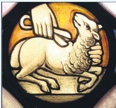
Glas-in-lood raampje in Majella-kapel

Waar is Concordia? Niet alle Bussumers weten het te vinden.