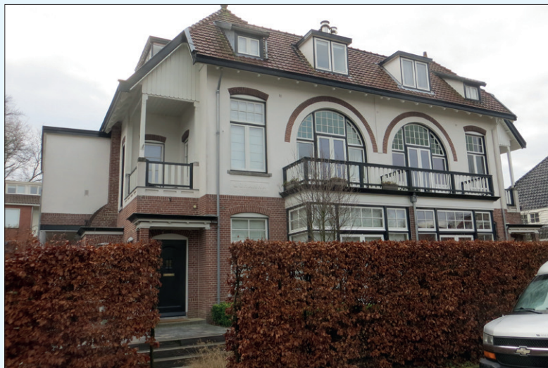
Mecklenburglaan 14 (links) in 2020