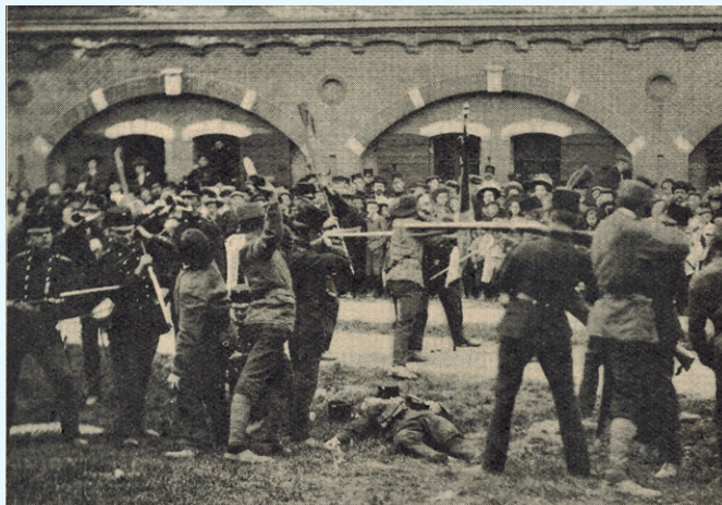
Een strijd om de vlag door dezelfde Vereeniging gegeven op plein vóór de bomvrije artilleriekazerne

's Avonds voerden leden en aspiranten van de Gymnastiek-Vereeniging boven op artilleriekazerne standen uit, verlicht door bengalisch vuur, die een buitengewoon mooien indruk maakten.