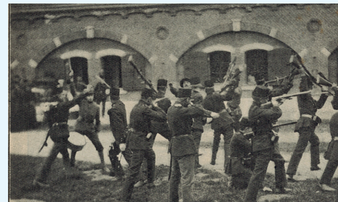
„Colonne geweer” door de Schiet- en Weerbaarheidsvereeniging „Huibert van den Eyken” te Naarden.