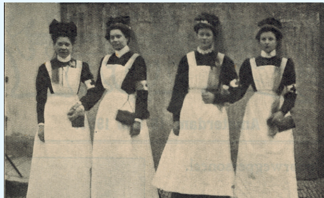
Verpleegsters te velde van „Volkswaarbaarheid”. Jonge vrouwen die mede kunnen werken bij de verdediging des vaderlands