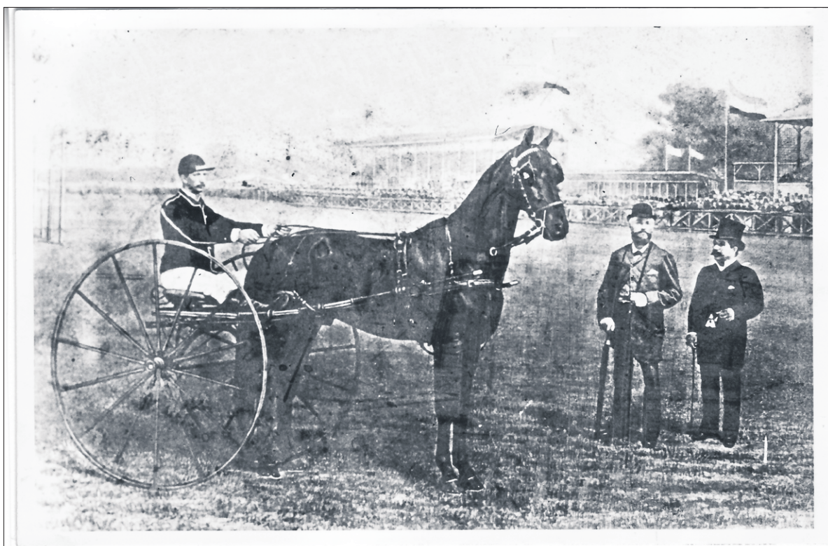
■ Koning Willem III met burgemeester Langeveld van Bussum bij een jockey. Op de achtergrond de hoofdtribune.

Naast de tribune waren een salon met een terras, enkele toilet-kamers en een keuken gebouwd. De spiegelbakken op het parcours waren versierd met bloemen en langs de heuvel stonden rijen planten. Er was zelfs een telegraafkantoor uit de grond gestampt om de uitslagen van de wedstrijden zo snel mogelijk door te geven aan de wedkanten. Meteen na de wedstrijd werd het weer afgebroken.