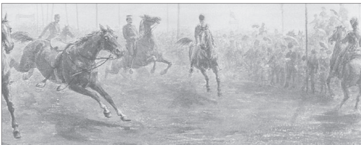
■ 'Courses de Bussum', aquarel van Otto Eerelman (Collectie Heynen).

www.gooienvchthistorisch.nl 035 207 09 99 Cattenhagestraat 8, Naarden