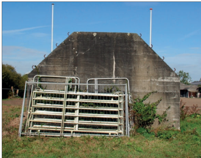
■ HM15 op het terrein van de manege.

Men begon aan een enorme klus. Alleen al het uitrusten en schoonmaken van het object was een hels karwei. Bovenop werd een hokje getimmerd van 2 x 3 m, voorzien van een dak dat via een stalen geleideconstructie kon worden opengeschoven. Dit was de waarnemingskoepel, waarin de zelfgebouwde kijker werd opgesteld. Om daar te kunnen komen werd een stalen buitentrapp met bordessen gemaakt. Binnen in de betonnen schuilplaats werden een controlekamer en een nachtelijk onderko-