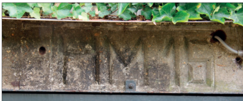
■ Het nummer HM16.

In 1986 kreeg de Muiderbergse Sterrenwacht een zelfgebouwde nieuwe kijker. Inmiddels was echter de lichteinder door de A6 zo sterk dat alleen meteorenwaarnemingen konden worden gedaan. Toch was op 28 november 1987 de komeet Bradley die bij helder weer om half acht 's avonds te zien. Op woensdag 21 juli 1994 werd een