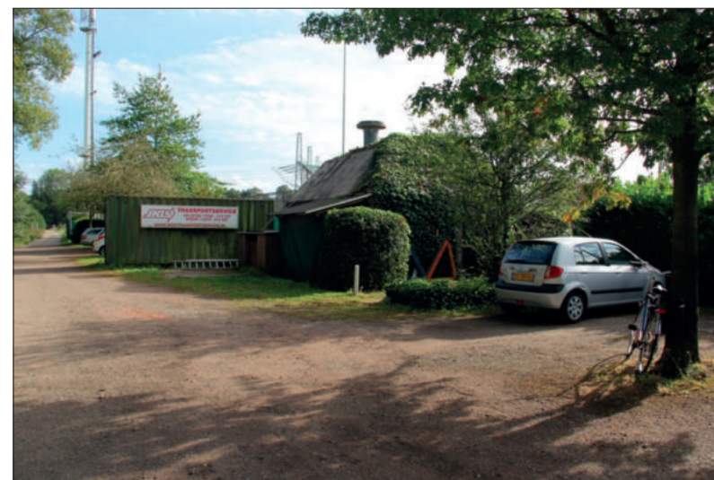
■ HM16 op het terrein van de tennisvereniging.