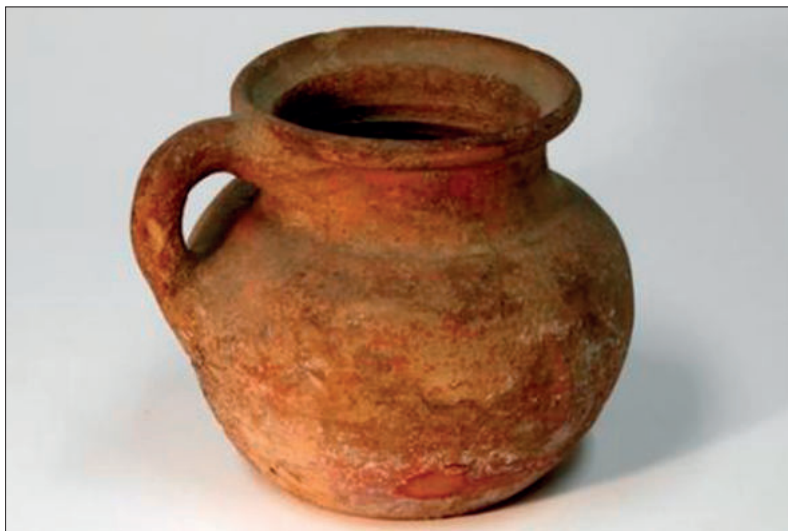
■ Urn uit een grafheuvel op de Westerheide (Museum Hilversum).