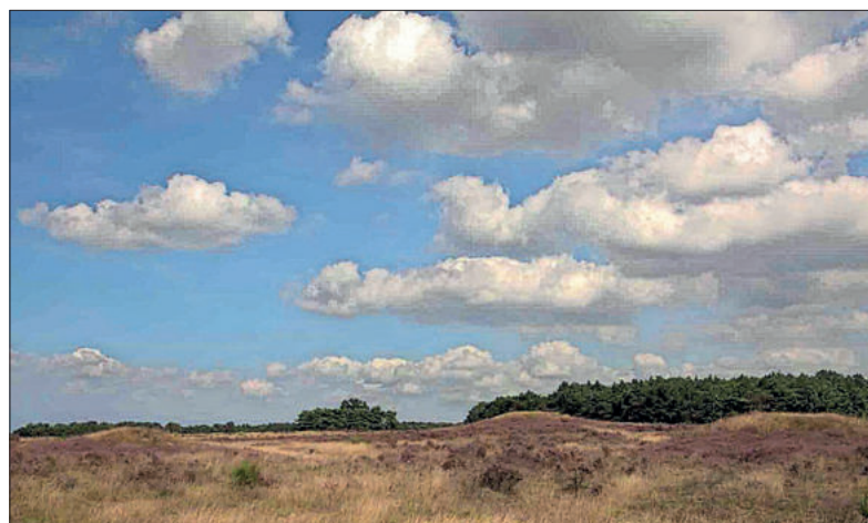
■ Grafheuvels op de Westerheide

FOTO EN TEKST: STREEKARCHIEF GOOISE MEREN