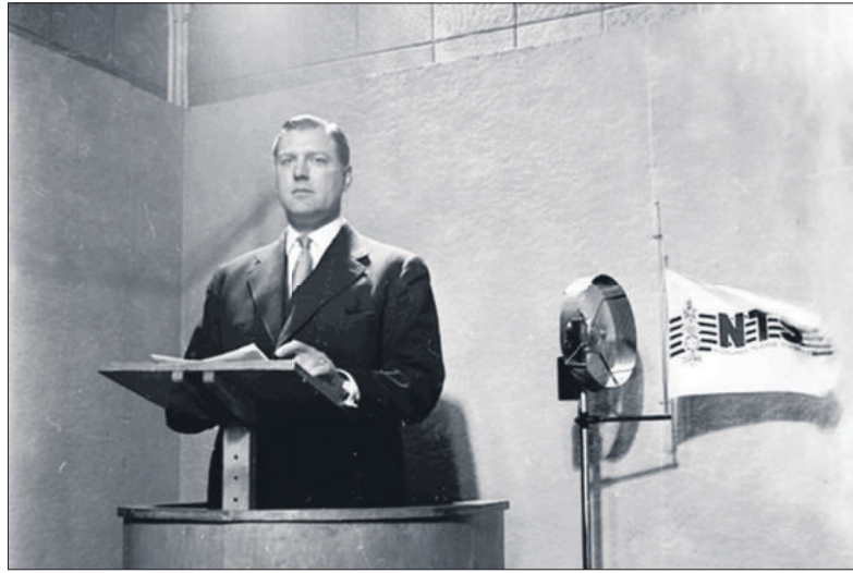
■ Tijdens een van de eerste tv-uitzendingen in 1951 wordt de werking van de televisie uitgelegd.